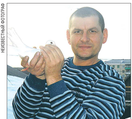
Зачастую именно почтовые голуби используются на свадьбах. Молодожёны отпускают их в небо, птицы взлетают и возвращаются к хозяину. А поскольку заводчик каждый раз продаёт одних и тех же голубей, этот бизнес может быть очень даже прибыльным