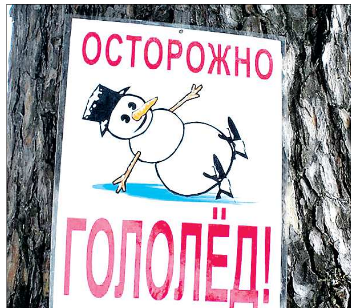
Если лёд с улиц не убирать, то никакие предупреждающие таблички не помогут

— Можно представить, насколько у нас в городе скользко, если уж ребёнок на это указал. Очень тяжело ходить — по дороге на работу раза три чуть было не растянулся на льду. Страшно представить, каково пожилым людям! У молодёжки хоть кости покрепче, хотя в травматологических отделениях уже «попсаемость» увеличилась. Депутаты не раз обращались к администрации с предложениями как-то улучшить ситуацию: закупить па-