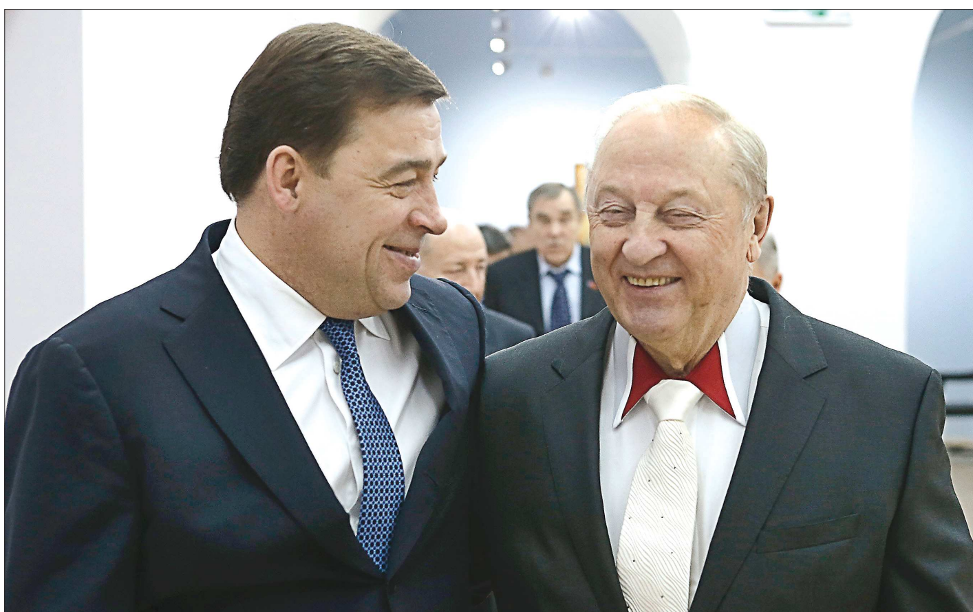
Во время инаугурации Евгения Куйвашева в мае 2012 года Эдуард Россель отметил, что новый губернатор «отлично справится с должностью. Главное – не рассчитывать на помощь Москвы, зарабатывать самим и жить по средствам»

На Среднем Урале принята новая инвестиционная стратегия региона до 2030 года. Она создана на базе программ, которые были разработаны по инициативе прежнего губернатора Эдуарда Росселя. Евгений Куйвашев неоднократно отмечал, что для развития любого региона важно сохранить преемственность традиций и власти, возможность перенимать опыт предшественников