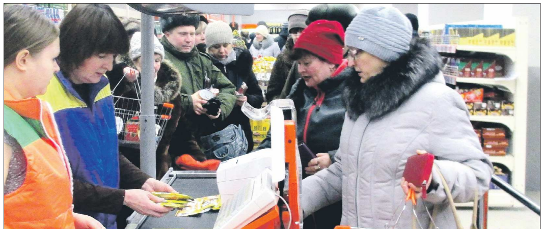
Специалисты Роспотребнадзора советуют потребителям всегда сохранять чек при покупке. В крайнем случае это поможет вернуть некачественный товар и обратиться с жалобой в надзорные органы

Время от времени этим фондом пользуются люди, оставшиеся без жилья. К примеру, погорельцы из посёлка Старатель были рады такой заботе города. А вот недавно пострадавших от пожара жильцов элитного дома на улице Учительской предложение мэрии переехать на время в общежитие оскорбило не на шутку. Мол, что вы нас в клоповник посылаете! Не вдохновила идея жить в помещениях маневренного фонда и вынужденных переселенцев с Украины. Те, кто остались в Нижнем Тагиле на постоянное жительство, предпочли снимать жильё у частных.