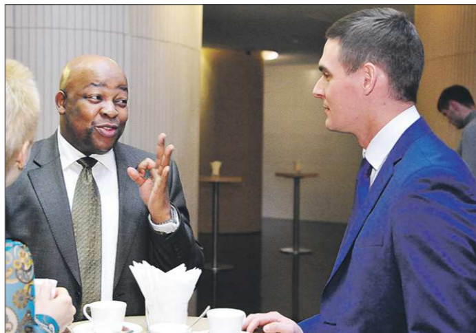
Посол ЮАР в РФ Мандиси Мпахлу и министр международных и внешнеэкономических связей Свердловской области Андрей Соболев. По словам министра, визит делегации ЮАР на Средний Урал — это начало нового этапа партнёрских отношений

— Мы убеждены, что будущее России — в таких регионах, как Свердловская область, — сказал дипломат и признался, что идея организации бизнес-форума на Среднем Урале родилась у него после посещения выставки «Иннопром-2014». — Южная Африка впервые участвовала в этой выставке, поэтому мы занимали на ней лишь небольшой уголок в экспозиции Торгово-промышленной палаты, где поста-