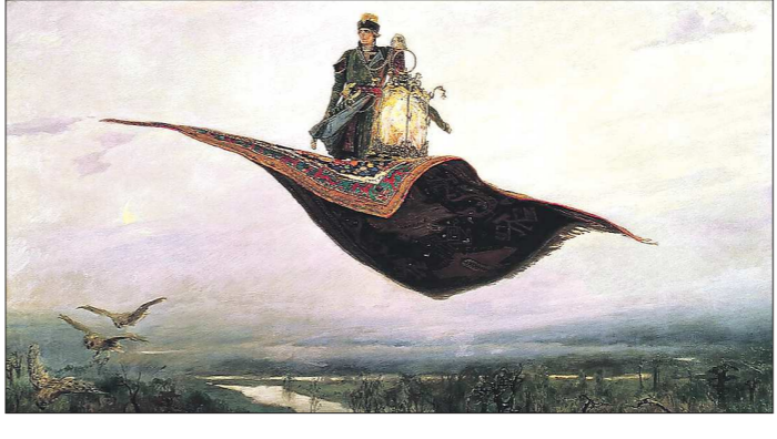
Картина Виктора Васнецова «Ковёр-самолёт»...