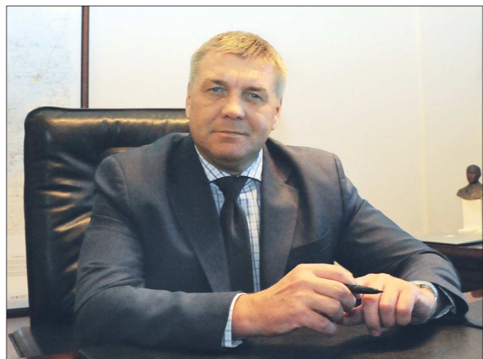
Сергей Логинов: «К налоговой дисциплине приучать нужно с детства. Поэтому в ноябре пройдёт всероссийская акция — уроки налоговой грамотности для учащихся младших и старших классов. Школы Свердловской области, безусловно, примут в ней участие»

— Какие налоги собирают сложнее всего? — Самые тяжело собираемые — налог на доходы физических лиц (НДФЛ) и налог на добавленную стоимость (НДС).