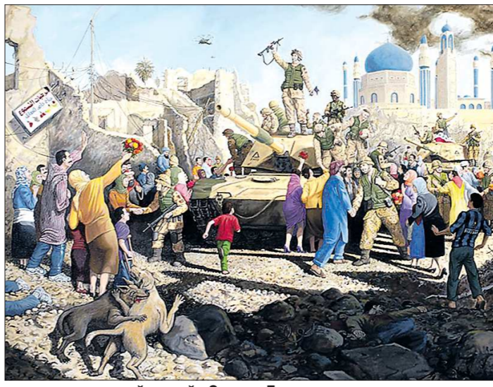
...и саркастический римейк Сэндоу Бирка со множественными отличиями