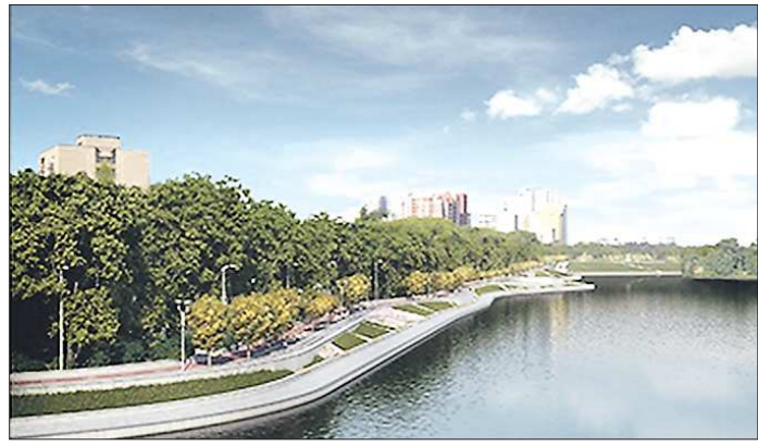
Так будет выглядеть после реконструкции ныне подзаброшенный правый берег Исеты