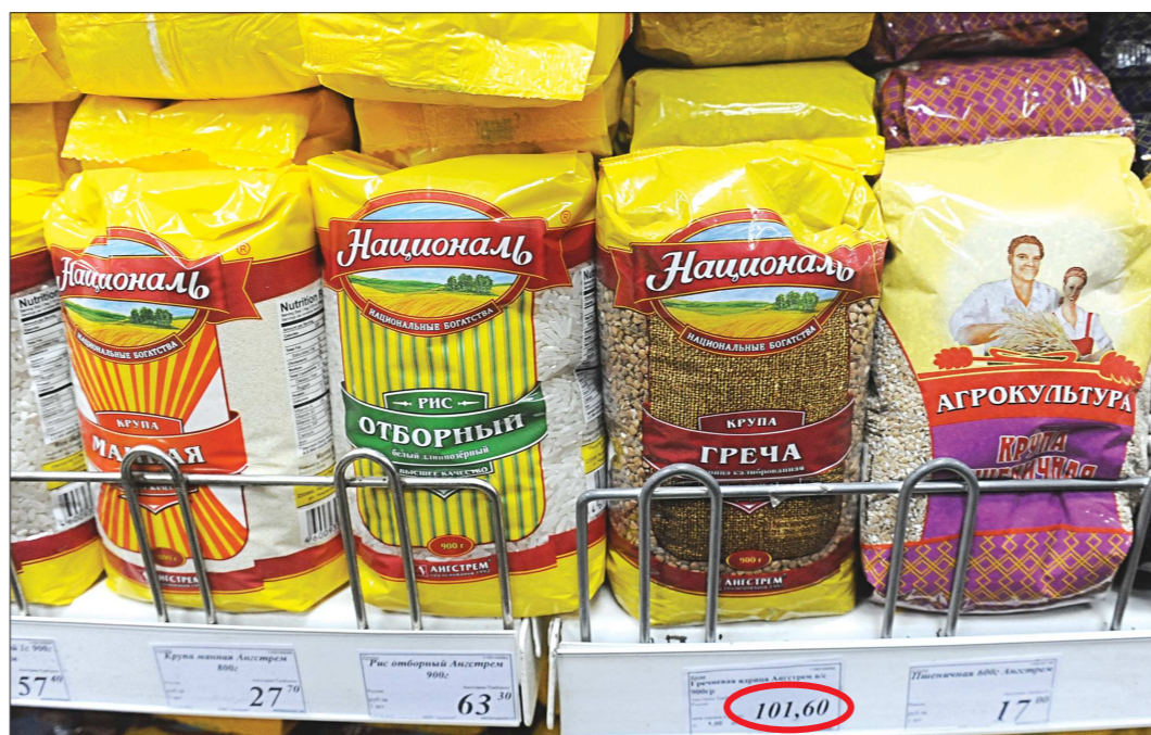
Этот снимок сделан несколько лет назад. Тогда на короткое время греча стала королевой на бакалейной полке. Сегодня история повторяется

Экономические санкции, на ваш взгляд, уже оказали какое-то влияние на объёмы налоговых поступлений?