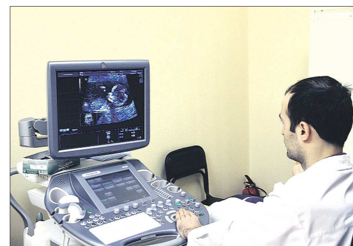
В клинично-диагностическом центре «Охрана здоровья матери и ребёнка» жительницы из самых отдалённых территорий за один день получают и диагностику, и консультацию