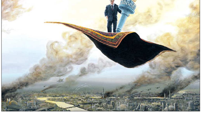
...и свой взгляд Сэндоу Бирка