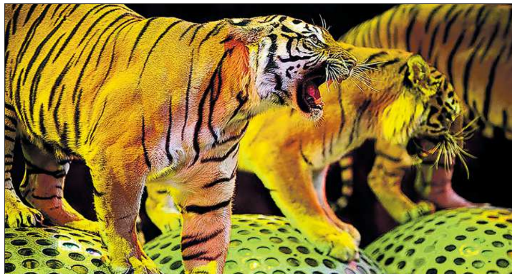
Мстислав Запашный привёз в Екатеринбург 15 тигров. Ежедневно каждый из них съедает по 9–9,5 килограмма мяса (60 процентов говядины, 40 процентов конины)

— Любое ЧП — это прежде всего ошибка дрессировщика. Я стараюсь не допускать таких ошибок, поэтому у меня, к счастью (судящее «тыфу-тыфу» через левое плечо. — Прим.ред.), всего три раны: на руках и на голове. Тигры у меня все хищные. Мы полощем им рот специальным раствором, чтобы не развивался стоматит и другие зубные болезни. Чтобы провести эту гигиеническую процедуру, надо попасть тигру в рот этим раствором из специальной клизмы. Делать это надо очень внимательно, а я заезвлялся, нарушил границу, просунул руку дальше дозволённого... Доли секунды не прошло, тигрица — раз! — и лапой мне по руке. У меня хорошая реакция, но тут я не успел убрать руку — порвала. Руку зашили, через неделю порвала (смеётся). — Прим.ред.) После этого стал внимательнее. А на голове шрам... Мы тогда работали с отцом, у нас был трюк — слон катал на себе тигра. Тигрица занервничала и пошла на слона спереди, а не сбоку, как надо, чтобы не напугать слона. И я вынужден был его собой перекрыть. Тигрица передо мной остановилась, сделала разворот и прыгнула через меня, используя мою голову как подставку! Я видел, как пролетают её пасть, белая грудь... Это всё — доли секунды, но за эти мгновения ползавший промелькнуло перед глазами. Потом я почувствовал, как на меня наступила лапа с когтями, они вонзились мне в голову... В этот момент я