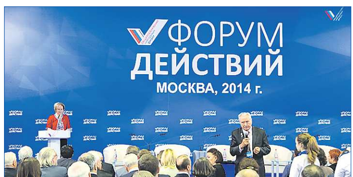
Форум собрал более тысячи членов ОНФ из всех регионов России