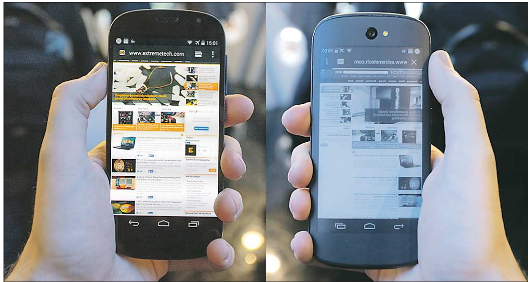
У YotaPhone два дисплея: спереди (на фото слева) — привычный цветной, сзади (на фото справа) — чёрно-белый, как у электронных книг

Уже несколько недель в Сети не утихают споры вокруг так называемого «первого российского смартфона», который Владимир Путин подарил председателю КНР Си Цзиньпину во время саммита АТЭС. Однако YotaPhone 2, разработанный российской компанией Yota Devices, назвать первым не позволяет даже порядковый номер модели аппарата. Первое поколение этих смартфонов поступило в продажу ещё в декабре прошлого года, но, мягко говоря, так и не сыскало популярности среди российского и европейского покупателя.