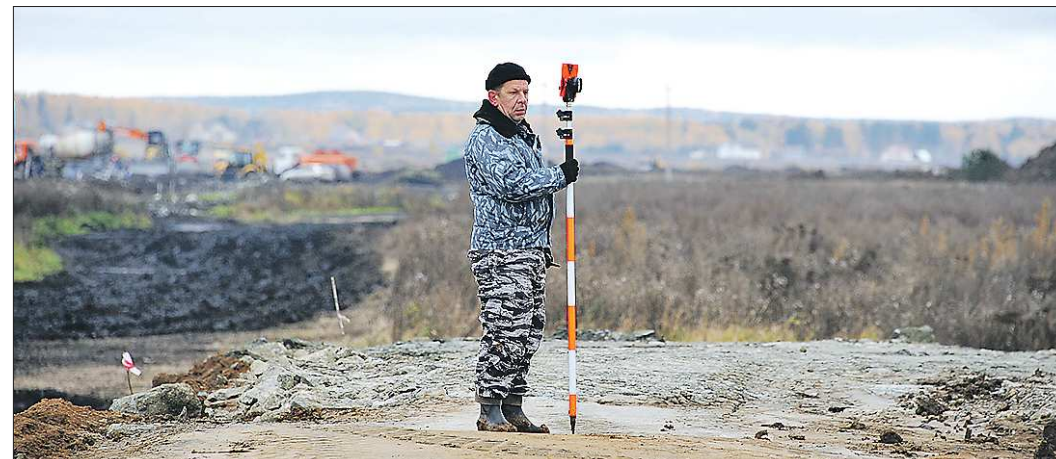
Прежде чем выделять кому-либо землю, нужно провести большую работу по оформлению на неё документов, а всё начинается с межевания...

— Лучшее цифр реальную ситуацию ничего обрисовать не может. Вот цифры. За 2013 год план поступлений от управления незарегистрированными участками перевыполнен по арендной плате на 21,4 процента, а по продаже — на 23,4 процента. А по итогам девяти месяцев 2014 года превышение плана по поступлениям от сдачи в аренду и продаже таких земельных участков