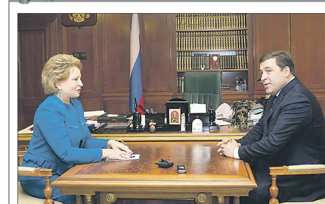
18 ноября состоялась встреча губернатора Свердловской области Евгения Куйвашева с председателем Совета Федерации Валентиной Матвиенко. Евгений Куйвашев проинформировал главу верхней палаты российского парламента о том, что по итогам 2014 года падения промышленного производства в регионе не будет. «В текущем году наибольший рост при сложных погодных условиях наблюдается в сельском хозяйстве. Мы собрали урожай на двадцать процентов больше, чем в прошлом году, и сегодня область полностью себя обеспечивает яйцом, мясом птицы, картофелем», — отметил он. Также Евгений Куйвашев рассказал, что в регионе хорошими темпами идет ликвидация очередей в детские сады. С начала реализации майских указов Президента введено 44 тысячи мест