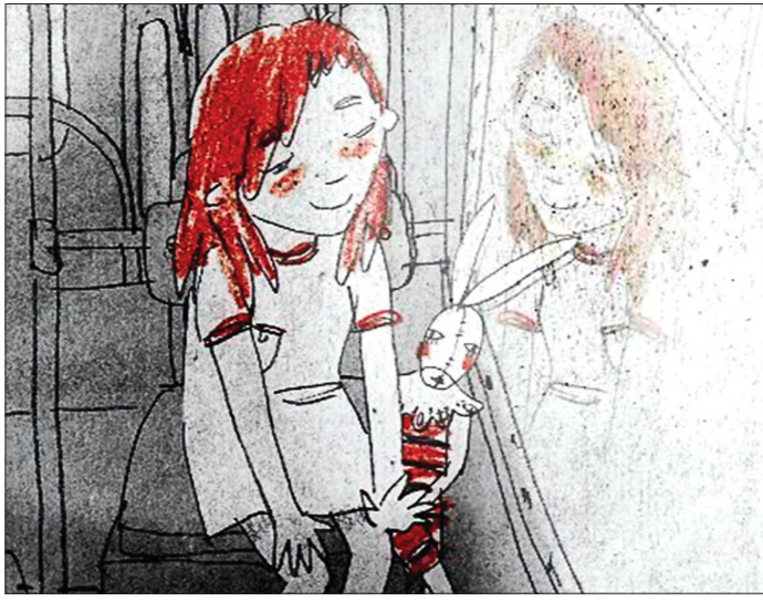
«При выходе не забывайте свои вещи» снят в 2012-м. Он рассказывает о девочке, которая торопится повзрослеть...

Это скорее российская тенденция. Потому что мировая анимация всегда делалась и для детей, и для взрослых. У нас стойкий стереотип, что мультфильмы делаются толь-