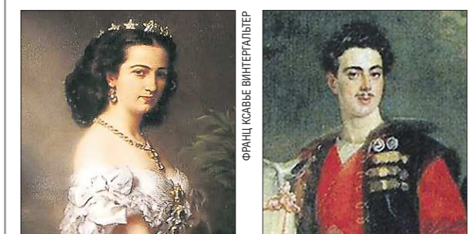
Матильда Бонапарт пережила Анатолия Демидова на 34 года