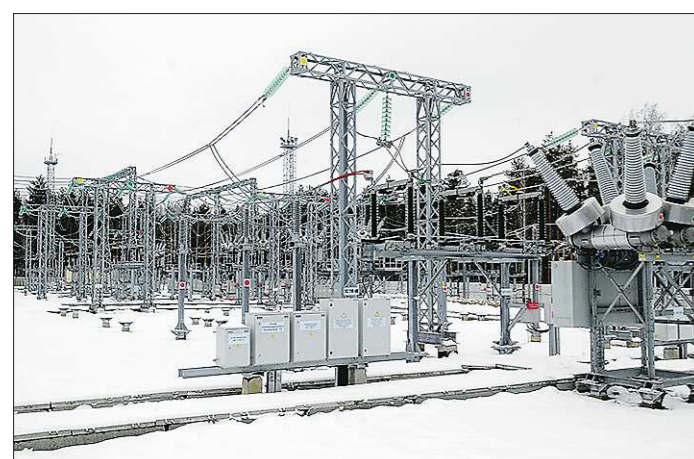
На реализацию проекта ушло 232 миллиона рублей