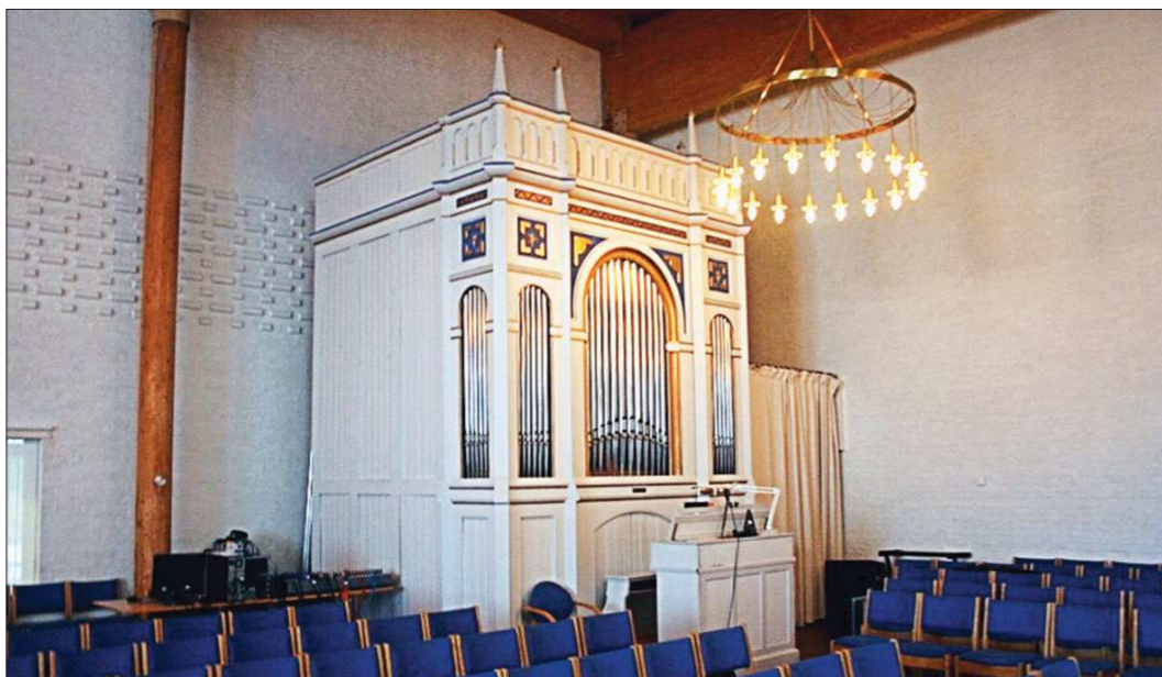
На норвежский орган претендовало несколько российских городов, но Нижний Тагил оказался самым расторопным и убедительным