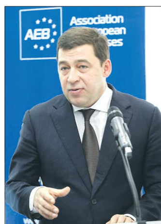
Евгений Куйвашев: «Мы видим интерес европейских бизнесменов к Свердловской области»

— Одним из важнейших направлений нашего сотрудничества с компаниями — членами АЕБ считаю модернизацию производств и привлечение новых технологий. Свердловская область, в свою очередь, не только открывает для европейских компаний рынок Урала, Сибири и Даль-