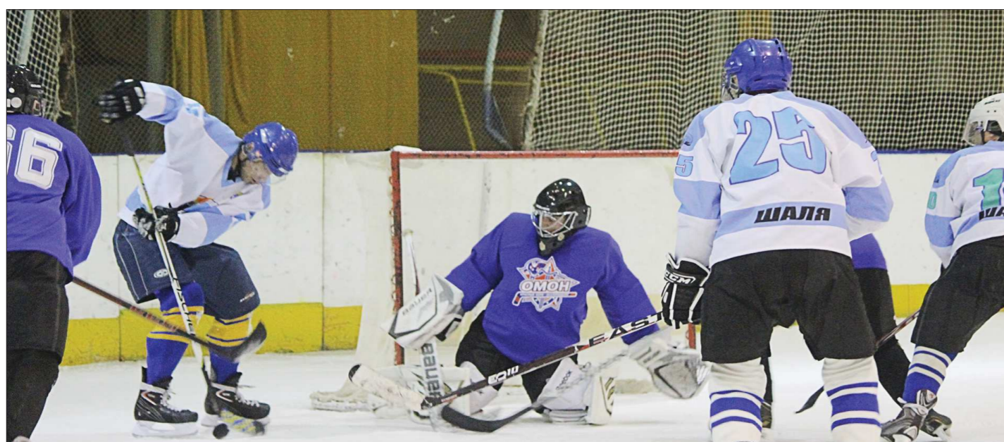
Казалось бы, спортсмены-любители не так, как профессионалы, нацелены на результат, но по накалу страстей на льду этого не скажешь

— Несколько лет назад посёлок Восточный, который относится к Сосьвинскому городскому округу, хотел присоединиться к Верхотурью. Из Восточного в Сосьву — 30 километров бездорожья. Я поддерживал жителей в их желании и даже пытался помочь им провести референдум. Но сосьвинская избирательная комиссия искала формальные отговорки. Одна из них заключалась в том, что посёлок с таким же названием есть в Камышловском районе и неясно, какой именно населённый пункт хочет присоединиться. В Сосьву понимают, что если отдадут