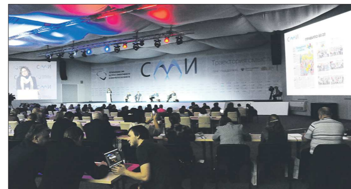
Пленарное заседание Первого форума региональных СМИ России прошло в конференц-зале выставочного комплекса «Екатеринбург-ЭКСПО»

Очень бурно обсуждалась уже на первом пленарном заседании форума тема выжива-