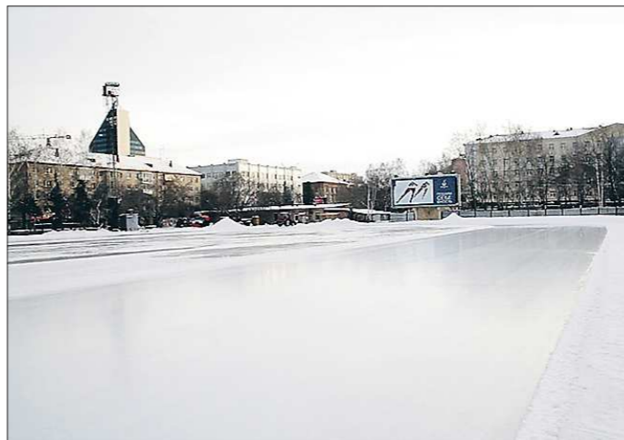
Лёд на стадионе «Юность» заливается трижды в день. Любый желающий сможет оценить его качество уже на этой неделе

В эти же выходные открывается для массового катания