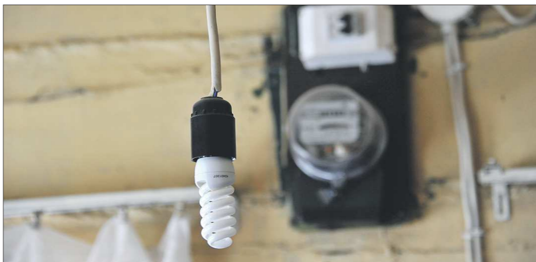
Даже в «плохой» сети энергосберегающая лампочка «накрутит» меньше

Бывает ли некачественной электроэнергия? Оказывается — да, бывает. Вернее, от производителя, а электростанция, вся энергия выходит соответствующей стандартам качества. А вот в жилом до-