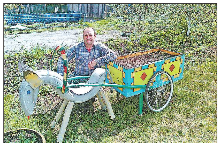
Ослик в саду у Потаповых «трудится» зимой и летом

Картина Волкова до 1978 года висела в Национальном художественном музее Белоруссии, а потом хранилась в рулоне в запасниках. Новьё выставили в 2005 году. Теперь она находится в Минске в Музее Великой Отечественной войны.