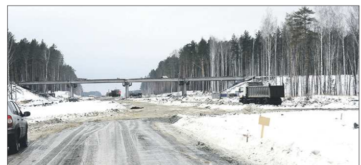
Уже в 2015 году по новому путепроводу пойдёт поток транспорта к Чусовскому озеру