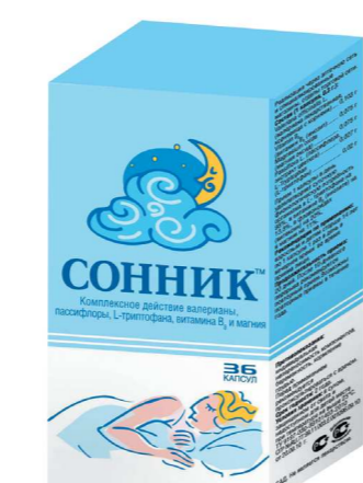
СПРАШИВАЙТЕ В АПТЕКАХ ГОРОДА!

СОННИК — ПРАВИЛО ХОРОШЕГО СНА. СОННИК — НА 100% НАТУРАЛЬНОЕ СРЕДСТВО УЛУЧШЕНИЯ СНА.