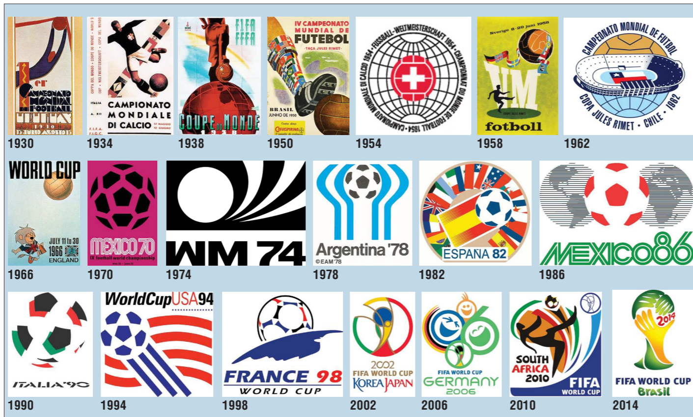
Так менялась эмблема чемпионатов мира: от Уругвая-1930 до России-2018