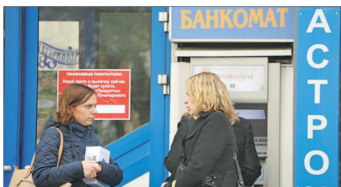
Сегодня более 90 процентов россиян получают зарплату на банковские карты