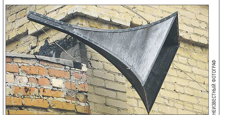
Вот так выглядели первые уличные репродукторы