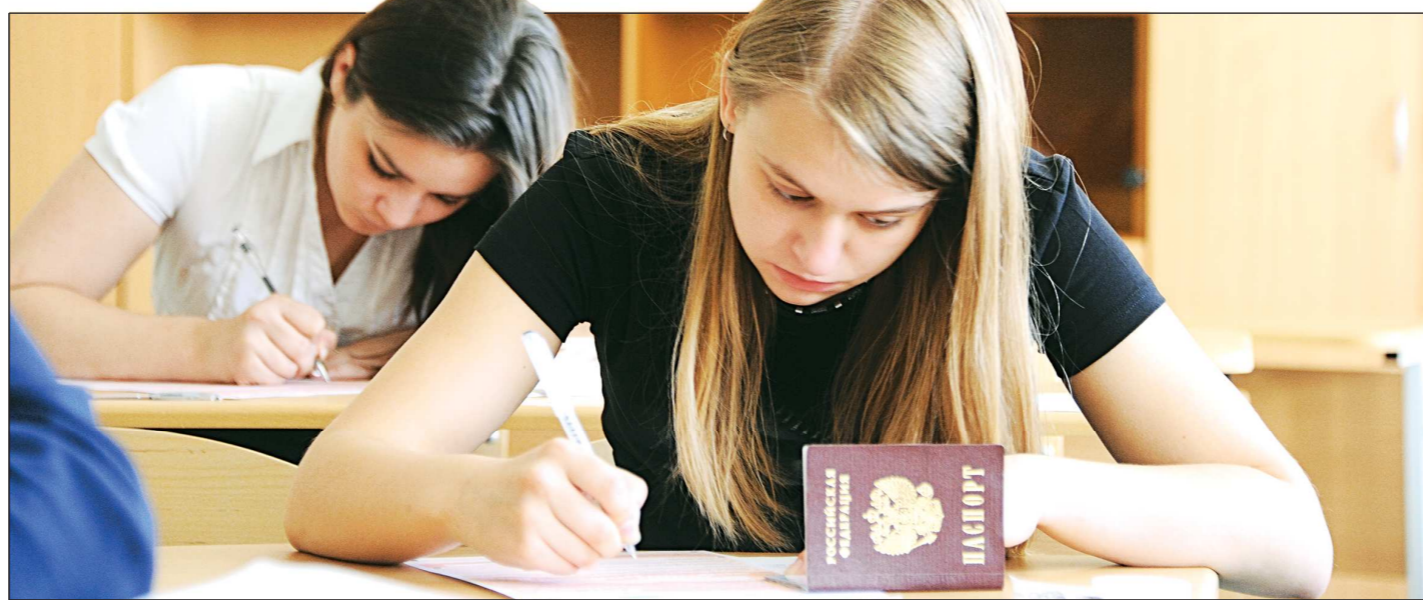
Сочинение школьники будут писать в декабре как допуск к традиционному ЕГЭ. Не удовлетворённые полученным результатом, смогут пересдать в дополнительные сроки