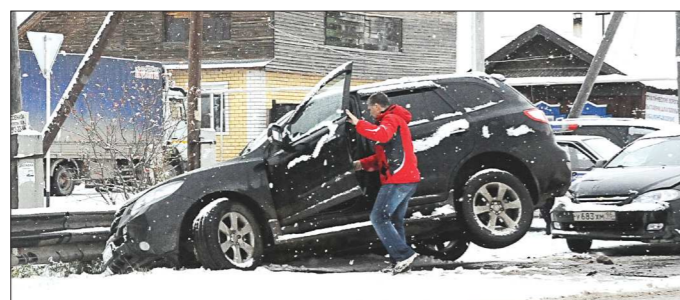
Первый гололёд запомнится надолго

Вчерашнее утро изменило привычные представления о пространстве и времени. Во всяком случае, у тех, кто встретил это утро на колёсах. И уж точно у тех, кто не успел до гололёда поменять резину.