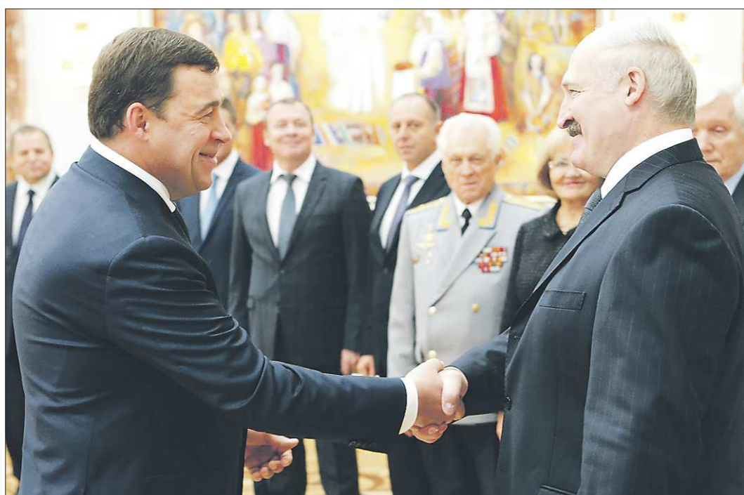
Евгений Куйвашев (слева) и Александр Лукашенко подтвердили взаимную заинтересованность Среднего Урала и Белоруссии в развитии сотрудничества

Александр Лукашенко отметил, что всегда придавал и придаёт величайшее значение сотрудничеству с руководителями субъектов Российской Федерации. Он назвал Свердловскую область экономически развитой территорией с высоким уровнем деловой, культурной, общественной активности и подтвердил готовность и впредь