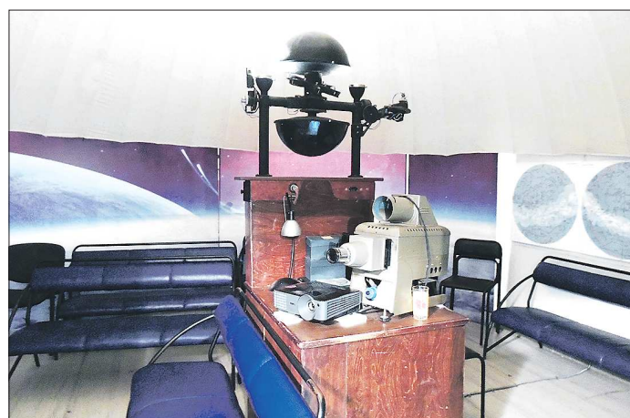
С помощью этого устройства посетители планетария могут увидеть основные созвездия Северного полушария, а также планеты, которые на реальном небосводе можно рассмотреть невооружённым глазом

— Планетарий у нас уже старенький, изношенный. Было предложение заменить оборудование и установить новый цифровой планетарий, но наше помещение для не-