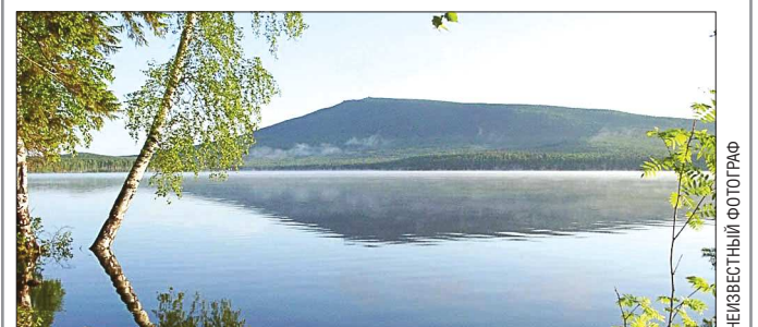
Свое название город получил по расположенной рядом горе Качканар