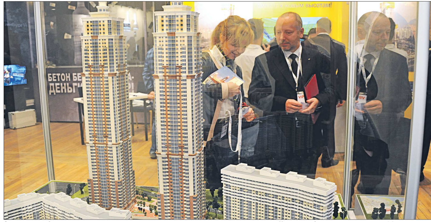
Эти екатеринбургские высотки с элементами «сталинского ампира» пока в проекте. Начало работ запланировано на 2017 год

Важно, что на протяжении последних двух лет по трём основным индексам показателя состояния окружающей среды у нас устойчивая динамика снижения нагрузки на окружающую среду. Если взять сравнение с показателями десятилетней давности, то снижение нагрузки будет в три-четыре раза.