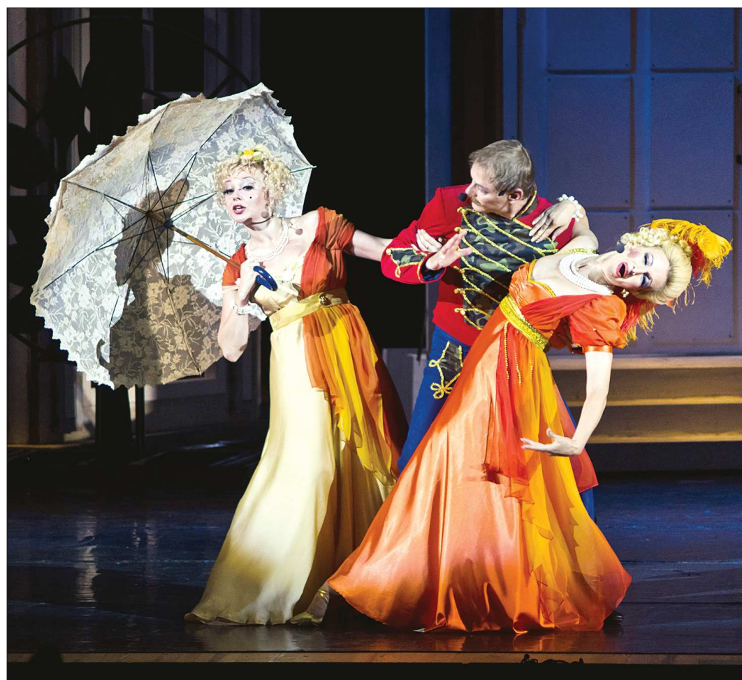
«Подлинная история поручика Ржевского» тоже особым образом связывает Белорусский театр с Россией: в гастрольной афише это единственный спектакль, музыку к которому написал российский композитор петербуржец Владимир Баскин

бриллиант гастрольной коллекции — первый белорусский мюзикл на историческую тему. В основе либретто — исторические сведения о браке семидесятилетнего польского короля Ягяйло и семнадцатилетней красавицы Софьи из белорусских Гольшан. Однако авторы расцвели исторический