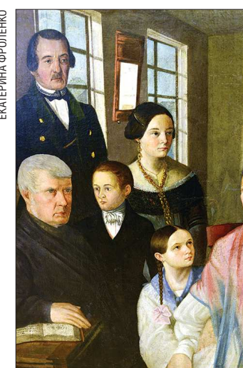
«Семейный портрет тагильских купцов» — одно из самых загадочных полотен на выставке. Ученые не знают ни имени купцов, ни автора полотна...