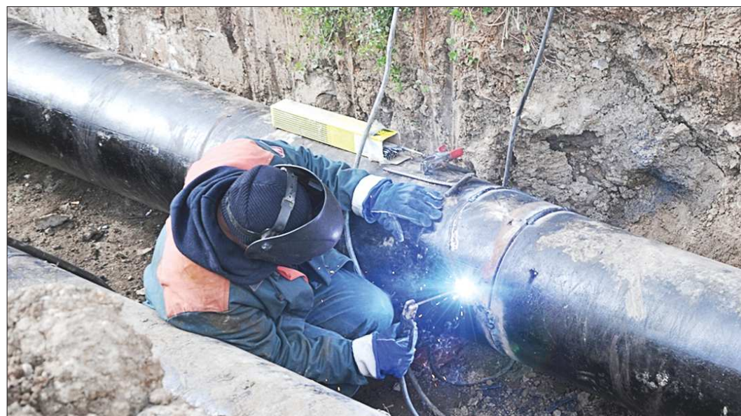
Нижнесалдинские коммунальщики пытались устранить порыв, но вскоре поняли, что это бесплозно – требуется замена большого участка трубы. Пока этого не произойдёт, тепло в центральной части города не появится. Сейчас в Нижней Салде объявлен режим ЧС

Эта ситуация не стала неожиданной. Ещё 18 сентября