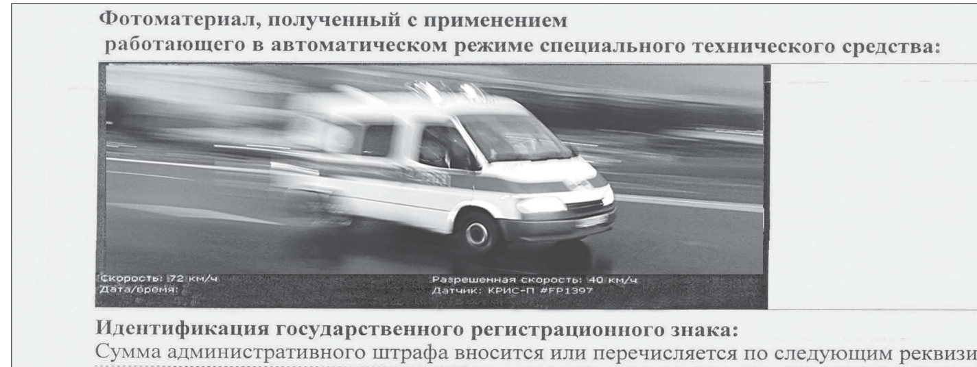
Фотоматериал, полученный с применением работающего в автоматическом режиме специального технического средства: