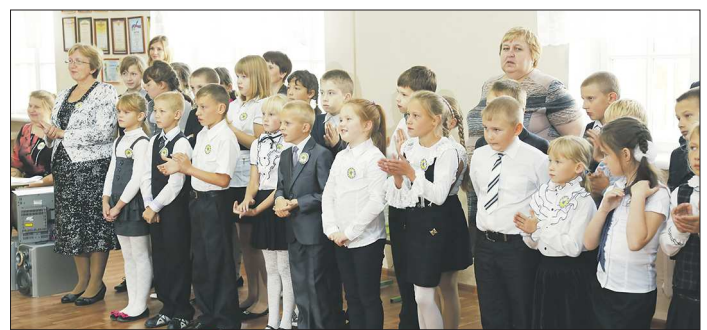
Линейка запоздала всего на две недели

На первых этапах ремонта дождливая погода вносила неприятные коррективы в график. Но, закончив операции на крыше, подрядчики ускорились. Решили, что тянуть до ноября не будут. Разве это дело — дети отстанут в обучении на целую четверть. На финише к подрядчикам присоединились учителя, родители, старшеклассники. Мыли полы, расставляли мебель, развешивали шторы. В итоге 11 сентября комиссия управления образования приняла школу. И в понедельник ученики наконец-то собрались на торжественную линейку.