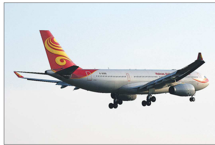
Рейс из Пекина в Екатеринбург будет выполняться лайнерами «Эйрбас» А330-200 с компоновкой в трёх классах обслуживания — экономическом, комфорт и бизнес

«Хайнаньские авиалинии» (Hainan Airlines) — китайская авиакомпания со штаб-квартирой в городе Хайкоу (провинция Хайнань). Основана в октябре 1989 года. Крупнейшая частная авиакомпания страны, занимающая четвёртое место в Китае по размеру воздушного парка. Четыре года подряд «Хайнаньские авиалинии» получают от британского рейтингового агентства «Скайтракс» наивысшую, пятизвездочную, оценку (сегодня в мире всего 7 авиакомпаний с данным баллом). В августе 2014 года воздушный флот авиакомпании «Хайнаньские авиалинии» состоял из 132 пассажирских и 7 грузовых самолётов. Средний возраст судов — 5,7 года.