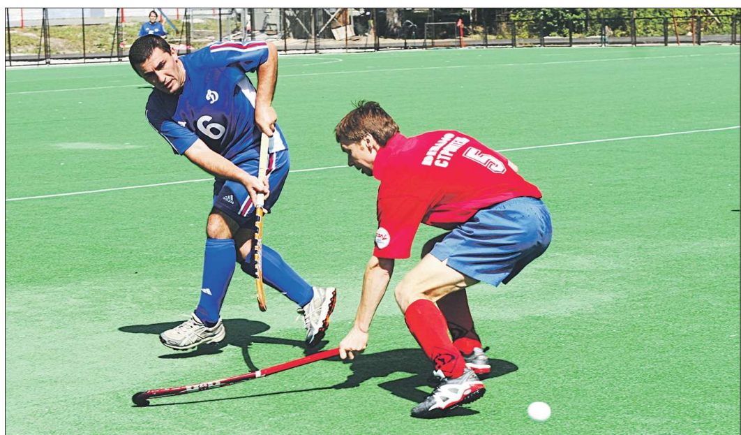
Поражение со счётом 0:8 — антирекорд команды «Динамо-Строитель». Ранее наша команда проигрывала максимум 0:7... и тоже казанскому «Динамо»