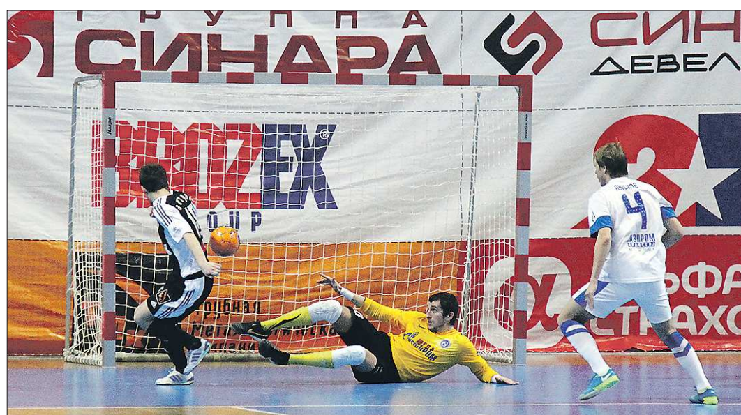
С каждым сезоном «Синара» всё труднее конкурировать с другими клубами, в составе которых большое количество легионеров

Кроме того, пропущенных голов стало меньше из-за увеличения времени владения мячом. В начале сезона 2013–2014 этот показатель у нас был самым низким в чемпионате — 42 процента. А весной результат удалось повысить до 53 процентов.