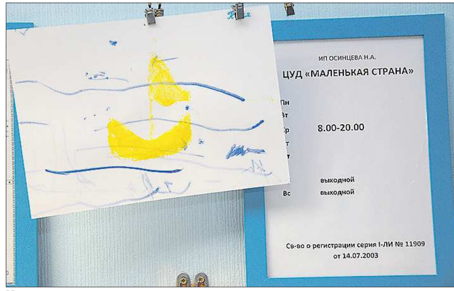
Маленькая страна негосударственных садиков скоро получит государственную поддержку

Для скорейшего решения задачи премьер предложил министерствам финансов и образования до 20 сентября проработать формулировки изменений в областной закон об образовании и другие нормативные акты, обсудить их с региональными институтами законодательства, с проку-