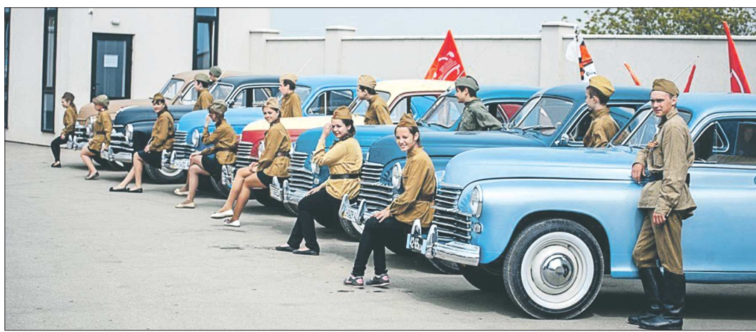
Медиаэкспедиция «Победы» в Крыму» из Югры до Крыма на ретроавтомобилях М-20 «Победа» добиралась две недели. А потом – ещё почти тысяча км на полуострове. В команде – члены молодежного парламента Югры, журналисты, блогеры

В столице Зауралья на шести дискуссионных площадках в Курганском университете собралось около 200 представителей общественных организаций из шести регионов. Темой форума под названием «Гражданское общество. Духовность. Культура» стало сохранение и возрождение традиций русской культуры, развитие культурного наследия и традиций народов, проживающих на территории округа.