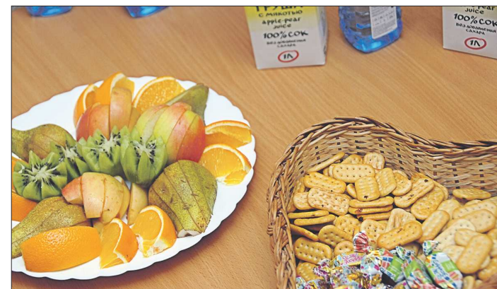
По данным исследования, сласти жители сёл любят больше, чем горожане. Среди обитателей городов сладкоежек набралось лишь 43%, а среди деревенских – более 61%

Кстати, на эту большую для многих НКО тему на форуме был проведен мастер-класс с мудрым названием «Фандрайзинг: как собирать средства на культурные проекты», провела который заместитель директора по развитию Свердловской академической филар-