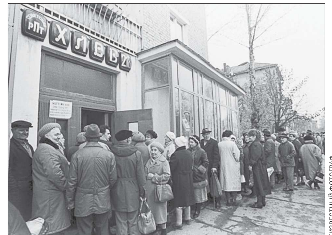
В этот день год от года как будто специально собирались на полосах «ОГ» разные неприятности и беды. Помимо уже упомянутых хлебных карточек, в 1991 году вспоминали имена погибших во время путча, в 1996-м – плакали учителя, месяцами не получавшие зарплату, а в 2000-м на траурном митинге поминали погибших на подводной лодке «Курск». И даже позитивные новости звучат как-то неудачливо: экономический подъём всего лишь «наметился», а манси всё-таки вымирают, хотя и рожают здоровых детей...