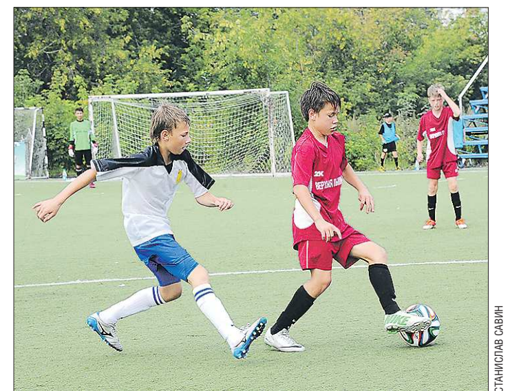
Юбилейный (пятидесятый) «Кожаный мяч» завершился неудачно для свердловчан