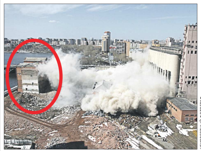
Ныне Симановская мельница, где был один из первых в городе телефонов – это часть Екатеринбургского мукомольного завода. В нынешнем году он оказался в центре внимания екатеринбуржцев из-за элеватора, который сносили направленными взрывами