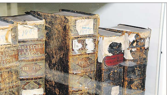
Помимо библиотеки, старинные редкие книги также хранятся в фондах музеев — например, Свердловского краеведческого. Со временем они также будут оцифрованы

— На нашей карте кинопроката около 60 точек. Но это не только сохранившиеся кинотеатры — это также районные Дома культуры, местные телестудии. — И сколько фильмов на данный момент может предложить фильмфонд? — Более 4 000 копий на плёнке и около 1 500 - на DVD. Но мы постоянно пополняем фонды новинками. Наиболее