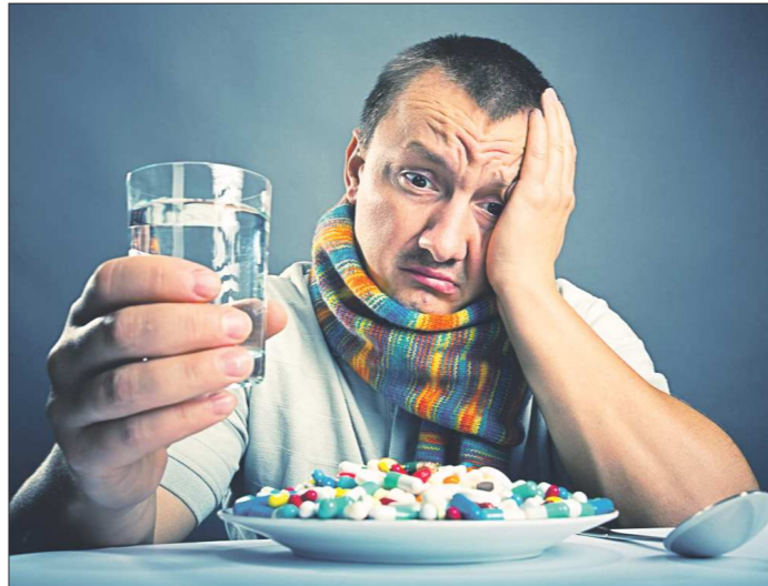
Нынешнее холодное и малосолнечное лето привело к тому, что свердловчане начали массово болеть простудой не в зимние месяцы, а уже в августе