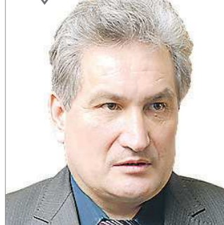
Юрий БИКТУГАНОВ, министр общего и профессионального образования Свердловской области