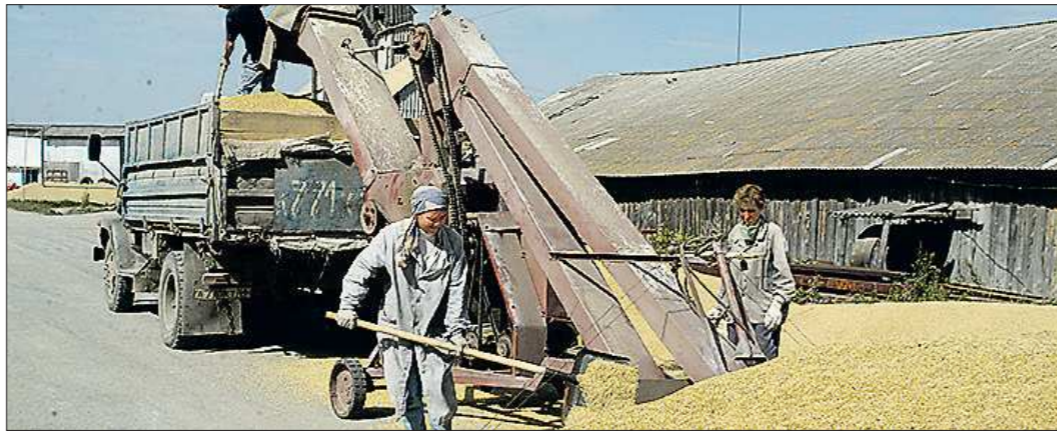
Кредитные проблемы инвесторов может с лихвой компенсировать нынешний урожай зерна: в Зауралье, по прогнозам, он будет высоким

Хозяйственный комплекс в Зауралье он приобрёл с правом отсрочки платежа на время оформления банковского кредита. Часть суммы выплатил за счёт собственных средств, на погашение оставшейся, по словам бизнесмена, ещё с февраля его обещали выдать кредит в Уральском банке Сбербанка России, но де-