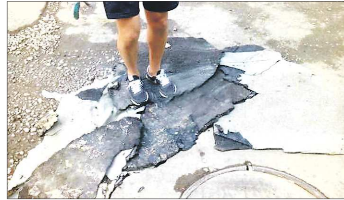
Катка у Александра нет, поэтому утрамбовывать рубероид приходится собственным весом