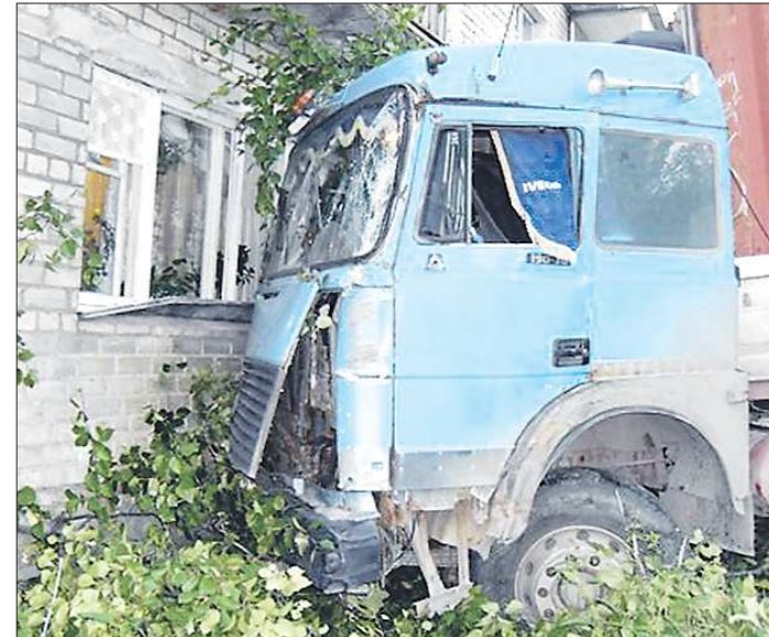
Виновник этого происшествия — водитель из Екатеринбурга — заплатит административный штраф в размере 500 рублей