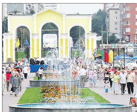
Первым делом в ЦПКИО им.Маяковского возьмутся за ремонт старого моста через реку Исеть