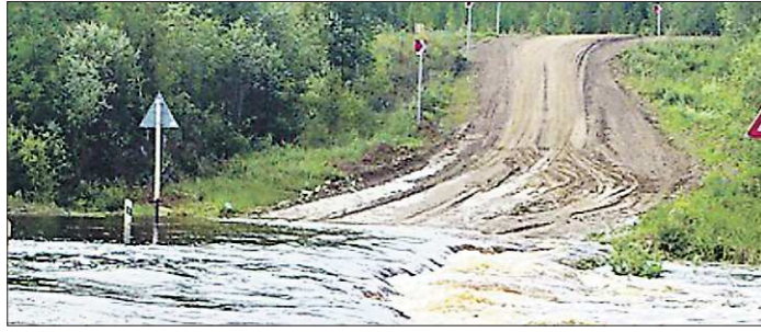
Так дорога в посёлок выглядела в этом году во время весеннего паводка