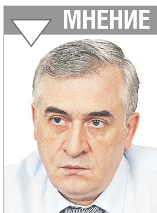
Яков СИЛИН, зампреда правительства Свердловской области