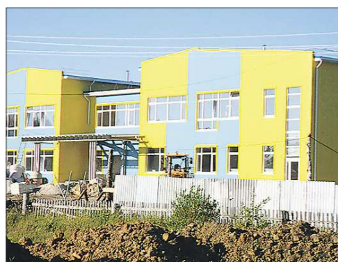
Новую школу на 154 места в селе Платоново планируют сдать к 1 сентября. Строительные работы подходят к концу