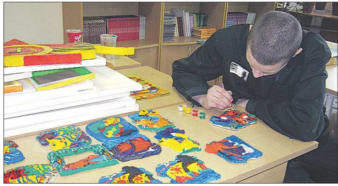
Кто знает, может быть, в следующей, нормальной жизни этому воспитаннику колонии пригодится и образование, и незатейливая техника работы с красками