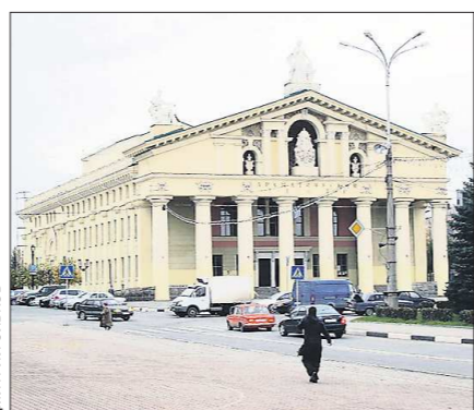
Во время ремонта здания труппа Театра драмы будет выступать на других площадках Нижнего Тагила