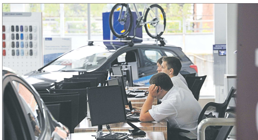
Рынок перенасыщен не только автомобилями, но и точками их продаж. Так, в Екатеринбурге сегодня работают более 70 дилерских центров и более 60 автосалонов

Спрос на машины действительно падает, — подтвердили в беседе с корреспондентом «ОГ» сотрудники екатеринбургского автоцентра «Автомобан». — Это происходит не-