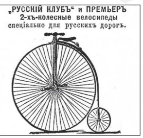
«РУССКИЙ КЛУБ» И ПРЕМЬЕР 2-х-колёсного велосипеда специально для русских дорог.