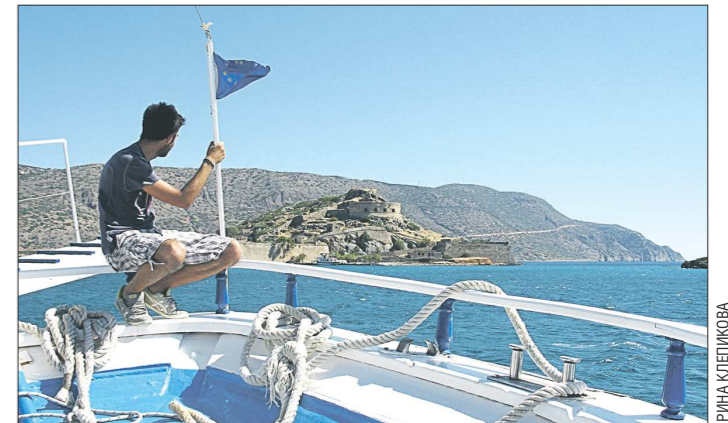
Катер «Арго» доставил группу APC-Пресс к необитаемому острову Спиналонга. О нём написан и переведён на 14 языков роман «Остров» британской писательницы Виктории Хислоп. Это была ещё одна попытка преодолеть предвзятость общества по отношению к больным проказой