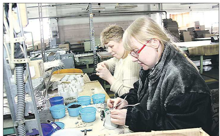
Сегодня на Среднем Урале проживают 298 162 взрослых инвалида, из них безработными являются 2 295 человек