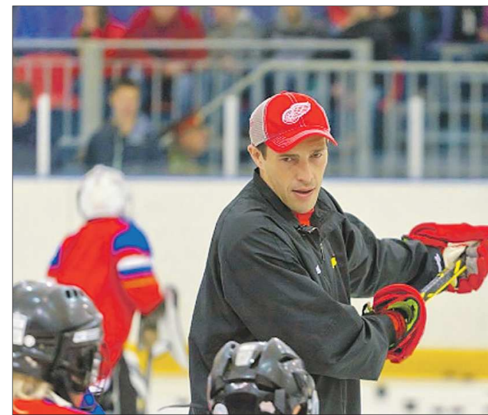
Со стороны мастер-класс Дацюка напоминает обычную тренировку

— Есть специальные школы, куда желающие могут записаться. Там учат разбирать в сортах чая, правильно их готовить. После обучения все ученики сдают экзамены. Но этого недостаточно. Я впервые попробовал хороший чай в Москве 10 лет назад. После этого и увлёкся этим напитком. В России тогда на эту тему практически не с кем было общаться, поэтому я ездил в Китай, смотрел, как там работают люди на плантациях, как устроены их предприятия. Стал учить китайский язык. Тогда это была вынужденная мера, а теперь я понимаю, что и сегодня без этих поездок и знания китайского невозможно настоящий мастер.