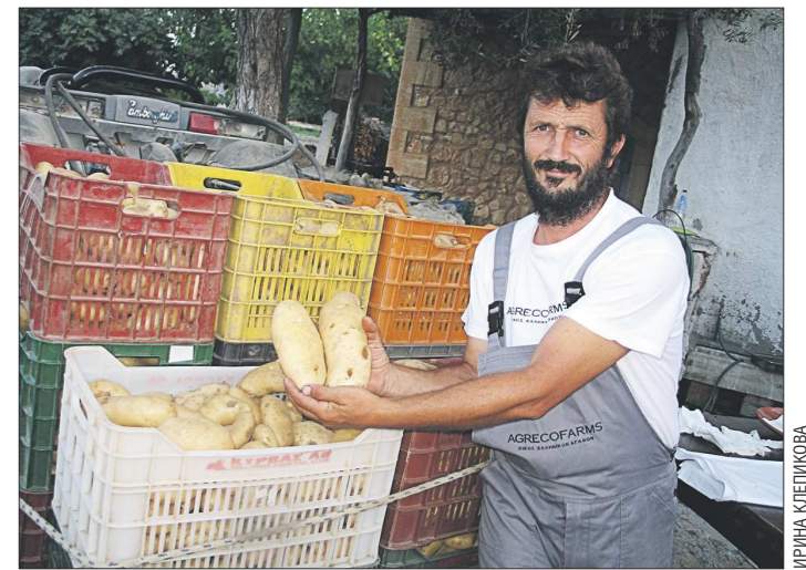
Нет, это не батоны хлеба. Это картофель! Фирма «Agrecofarm», представляющая агротуризм Греции, не только потрясает плодами своего труда, но и предлагает гостям самим... пододти коз, отжать (старинным способом, ногами!) виноградный сок или поучаствовать в сборе оливок