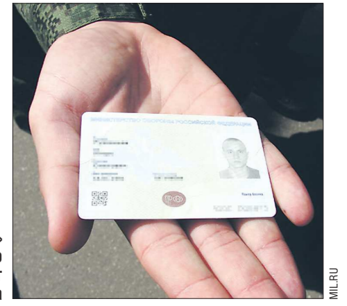
«Личное дело» военнослужащего теперь занимает очень мало места