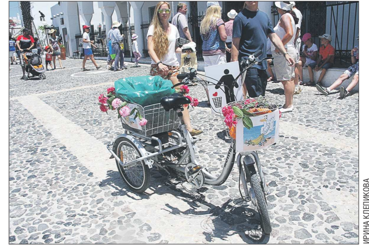
Позитивно настроенные греки даже урну для мусора устроили так, что и захочешь – мимо не пройдёшь