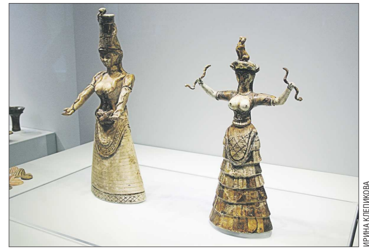
Культурные статуэтки, найденные на раскопках Кносского дворца, – символ женственности. Обнажённая грудь – метафора материнства