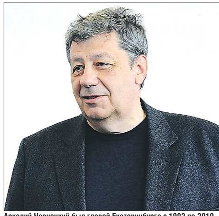
Аркадий Чернецкий был главой Екатеринбурга с 1992 по 2010 год. С октября 2010 года представляет Свердловскую область в Совете Федерации

— К реформе в первоначальном виде я относился категорически отрицательно. Считаю, что районное деление в крупных городах не просто не обеспечит развитие системы