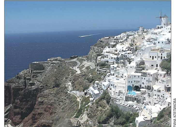
Остров вулканического происхождения Санторини живёт в вечном ожидании землетрясений. Предполагается: извержение вулкана Санторин (около полутора тысяч лет до н.э.), вызвавшее цунами высотой от 100 до 200 метров, и легло в основу библейского сказания о Всемирном потопе