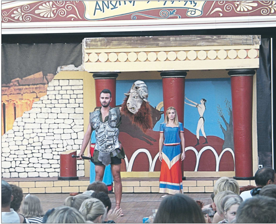
Мифы древней Греции – основа знаменитого ночного шоу под открытым небом, ради которого на Крит приезжают тысячи людей из разных стран

Чем же планируют греки удивлять и увлечь, особен-