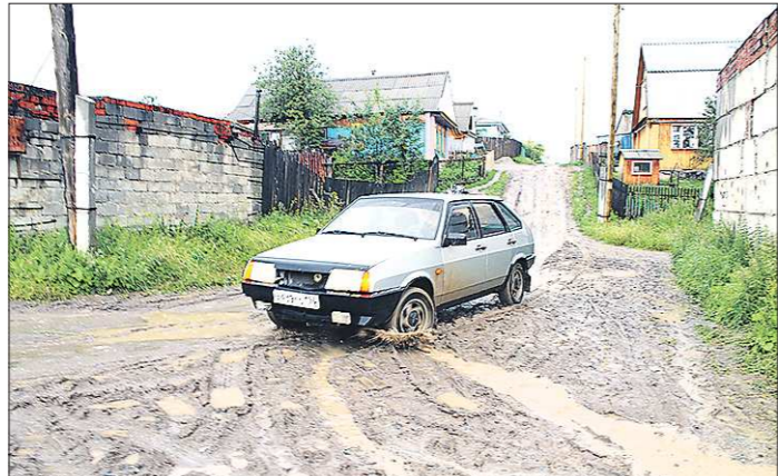
Улица Партизанская, город Реж. Это отнюдь не окраина — до администрации и центра города меньше одного километра, однако непохоже, чтобы чиновники сюда заглядывали

Упразднение оказалось преждевременным. На месте деревни развернулось строительство и дачных «фазенд», и нормальных домов, которые хозяева не планировали оставлять даже зимой. На разных берегах речки, тоже Ольховки, выросли две улочки. А так как в чистом поле право собственности на постройки не зарегистрируешь, народ решил пролить власти вешний призрак Ольховку населённым пунктом в составе Ачитского городского округа. Кроме того, рассудили: мол, за состояние дороги в деревню сейчас никто не отвечает, она что-то вроде лесной тропки. Как в таких условиях развивать какое-