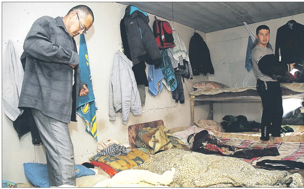
Жильцы-соседи таких «общежитий» вправе создать специальную комиссию и выяснить, сколько человек действительно проживает в квартире

– А представляете, сколько воды они расходуют, когда моются после работы? Водосчётчик-то в этом «общежитии» нет, – рассуждает председатель совета дома. – Я обратился к участковому, он сказал, что ему пока некогда заниматься этим вопросом. Пошёл в управляющую компанию, говорю: «Сейчас за общедомовое потребление плату ограничили. Разве вы не заинтересованы в том, чтобы выселить непрописанных граждан?». А в УК мне откровенно отвечают: «Мы не имеем права вмешиваться в такие ситуации. А расходы компенсируем за счёт содержания жилья». Выходит, по вине таких квартирников и несознательных квартиродатчиков нам не отремонтируют асфальт около дома, не покрасят стены в подъездах или не предоставят другие услуги, заложенные в эту статью расходов.