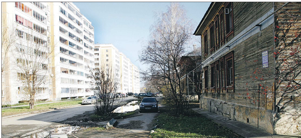
К 2017 году старых барачков, которые портят внешний вид городов, не станет

В 2012 и 2013 годах в Берёзовском возвели шесть новостроек, куда переехали 990 человек из 27 аварийных домов. В Арамилльском городском округе новоселье справили 616 человек, ранее проживавшие в 22 аварийных домах, а в городском округе Карпинске из 20 ветхих домов в новые квартиры переселились 306 человек. Об этом сообщил министр энергетики и ЖКХ Свердловской области Николай Смирнов на заседании регионального правительства.