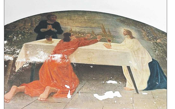
Фрагмент Тайной вечери