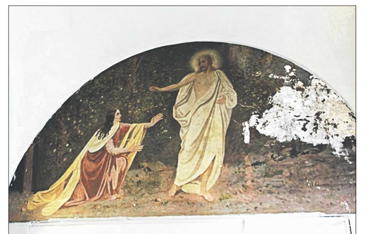
Так выглядели ещё до полной их реставрации фрески, созданные в 1916 году. Они изображают явление Марии Магдалины Воскресшего Христа