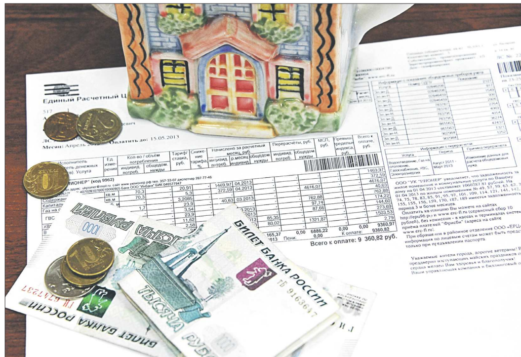
Строка «содержание жилья» включает в себя множество работ и услуг, часть которых некоторые управляющие организации на деле не выполняют

3. Если теплосчётчик установлен, зарегистрирован и работает без сбоев, почему плату начисляют по нормативам, а в отчёте указывают фактические затраты?» – Фактические затраты указывают для того, чтобы сделать перерасчёт. Если установлен УКУТ, а жильцы платили по нормативам, управляющая организация по итогам отопительного сезона обяза-