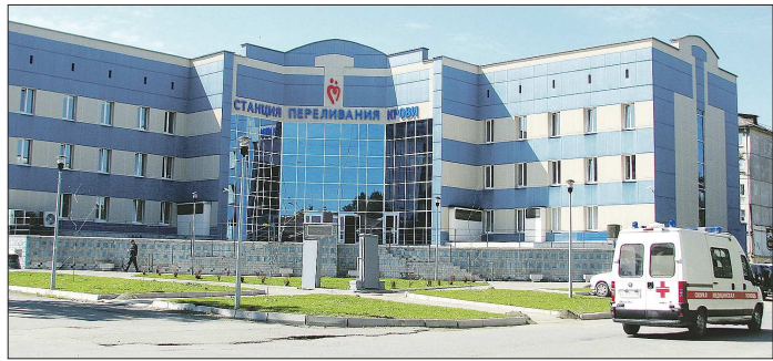
Здание для станции строили 10 лет и наконец сдали