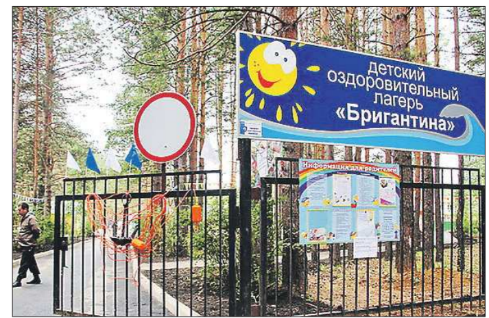
В этом году детский лагерь «Бригантина» примет три смены. Стоимость одной путёвки — 12 500 рублей