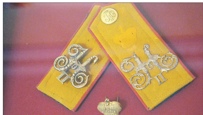
Так выглядели погоны рядового одного из грендерских полков русской армии