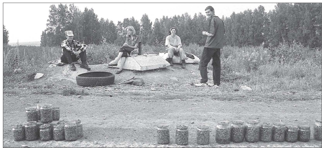
В Свердловской области – разгар ягодного сезона, время, когда деревенские жители могут существенно подзаработать на продаже земляники и черники. Для некоторых семей это превратилось в настоящий бизнес

– Я с полной ответственностью хочу сказать, что качество принимаемых законов сейчас не хуже, чем раньше. Зато скорость их принятия увеличилась. Раньше Палата представителей Законодательного Собрания имела право наложить вето на законы, одобренные Областной Думой, и тогда рассмотрение проекта начиналось заново. Это замедляло весь процесс. Напомню, переход к однопалатному парламенту и был необходим для того, чтобы иметь возможность быстро принимать решения, не ухудшая качество законов.