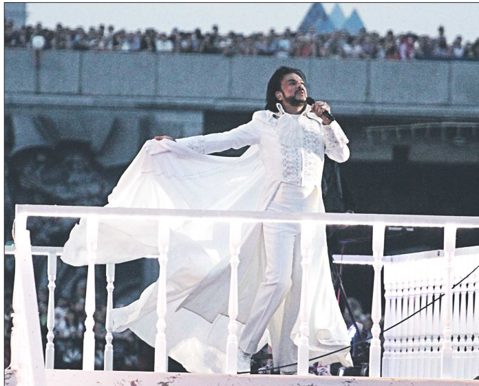
Увидеть Киркорова вблизи на 290-летию Екатеринбурга смогли, пожалуй, только фотографы. Тысячи горожан наблюдали за артистом с другого берега Исети

Выступления местных артистов на День города тоже планируются, молодёжь будет развлекать группа «Сансара», людей постарше – заслу-