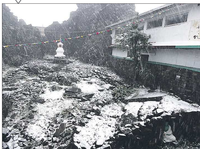
Этот снимок сделал Саттва Сати — один из послушников буддийского монастыря Шад Тчуп Линг, расположенного в окрестностях Качканара, прокомментировав его так: «Сегодня, проснувшись, мы увидели такую картину»