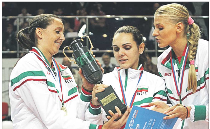
Сборная Болгарии впервые победила на Кубке Ельцина. Ранее они в 2008 году доходили до финала – и тогда уступили как раз России