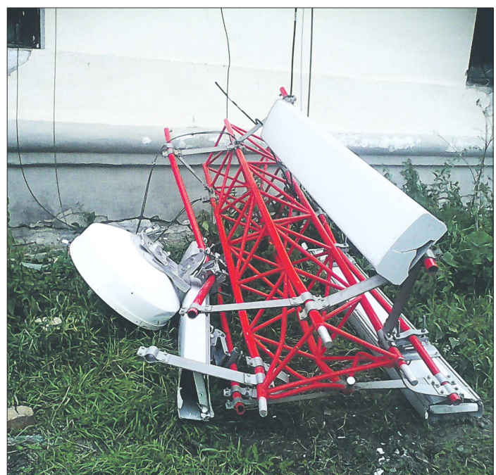
«Неураганно» ветра хватил, чтобы в Екатеринбурге упавшие деревья помяли несколько машин, а в посёлке Рудничный под Красноуральском рухнула вышка сотовой связи (на фото)

Записали Дарья БАЗУЕВА, Анна ОСИПОВА, Зинаида ПАНЬШИНА, Галина СОКОЛОВА