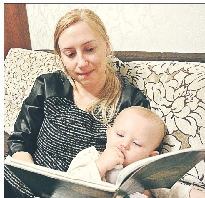
Книжка со сказками для малыша – не только картинки, но ещё и в какой-то степени учебник

– Письменная речь предполагает использование норм и правил. Человек не приходит на пляж в костюме или, наоборот, на официальном мероприятии в купальнике. Так и в использовании языка – нужно уметь переходить с разговорного на письменный и обратно. Но современная молодёжь делать этого не умеет. Я шесть лет проверяла работы ЕГЭ и очень часто сталкивалась с использованием разговорных конструкций в сочинениях. Слых и рядом выпускники начинают предложения со слов «ведь» и «потому что», а это недопу-