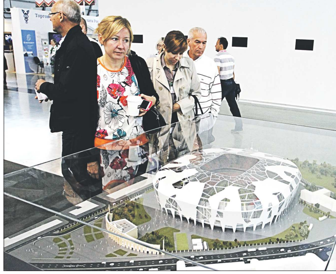
В августе на действующем Центральном стадионе пройдут пять последних матчей, после чего начнется реконструкция

По ту сторону океана, в фан-зоне на пляже Копакабаны, тысячи бело-голубых верили в чудо, несмотря на предсказания упрямых букмекеров. Но... сегодня солнце зашло за тучи, сегодня волны бьют так больно, я видел, как умирала надежда Аргентины, моя душа плачет. Лучший игрок вселенной Лионель Месси и на этом чемпионате был официально признан лучшим. Только вот радовался он этому примерно так же, как оставшиеся в живых в ЦПКИО в 4 утра радовались невесте отсюда взявшимися конфетти и феер-шоу. Месси нужно было срочно в раздевалку – плакатик, болельщикам нашей фан-зоны – на бесплатный автобус – спать.