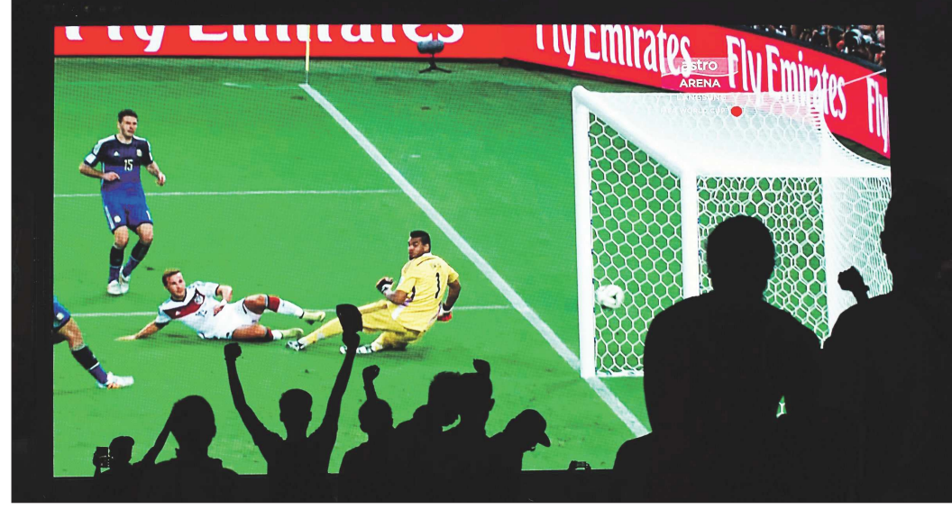
Аргентина могла стать трёхкратным чемпионом мира по футболу, но гол Гётце разрушил эту мечту

Да, правы оказались соцсети своей бессмертной цитатой: У Бразилии есть Неймар, у Аргентины – Месси, у Португалии – Роналду, а у Германии есть команда. 18 голов за немцев забивали восемь разных футболистов. Из семи аргентинских мячей – четыре на счету Месси. У Лео ещё есть шанс. Через четыре года он будет блистать в одной дальней-предалёкой стране, а если повезёт – в одном далёком-предалёком городе с труднопонимаемым названием и почему-то расположенном в Азии.