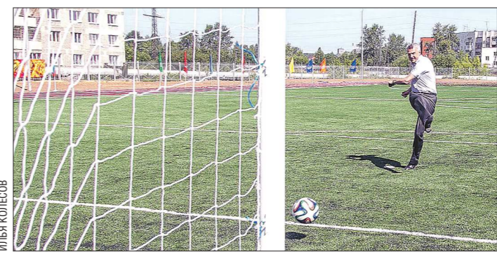
Первый гол в ворота на новом поле забил мэр Нижнего Тагила Сергей Ногова

QR-код позволит вам с помощью сканирующего оборудования (в том числе и фотоаппарата мобильного телефона) найти документы, опубликованные на сайте http://www.pravo.gov66.ru/d140710