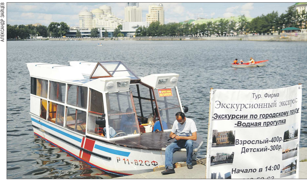
Прогулка на катере — дешёвое удовольствие, но екатеринбуржцев это не отпугивает. Среди горожан есть даже постоянные клиенты