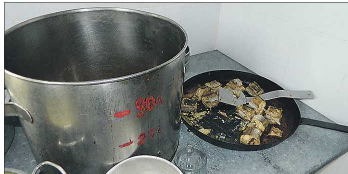
Заглянув на кухню муниципального лагеря «Мечта», сотрудники областной прокуратуры обнаружили грязную посуду и продукты, хранящиеся не по правилам