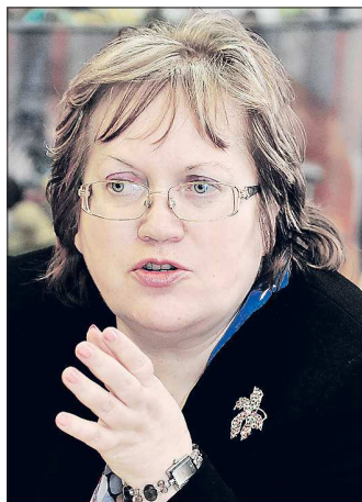
«Если вы выбрали госслужбу, значит, вы готовы чем-то жертвовать.»

Нам предстоит создать в обществе не только атмосферу нетерпимости к коррупции, утвердить антикоррупционные стандарты поведения, но и сформировать осоз-