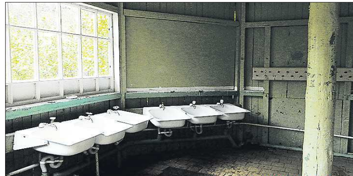
Умывальники в лагере расположены отдельно от туалетов. Чиновники от образования уверены: устранить нарушение, можно только перестроив здание