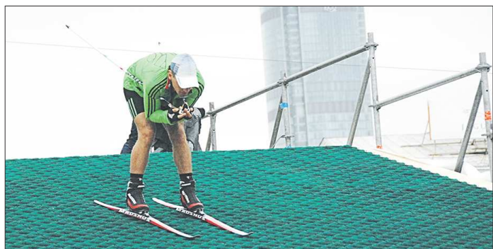
В 2012-м в «Звёздном биатлоне» принимала участие почти вся сборная России по биатлону