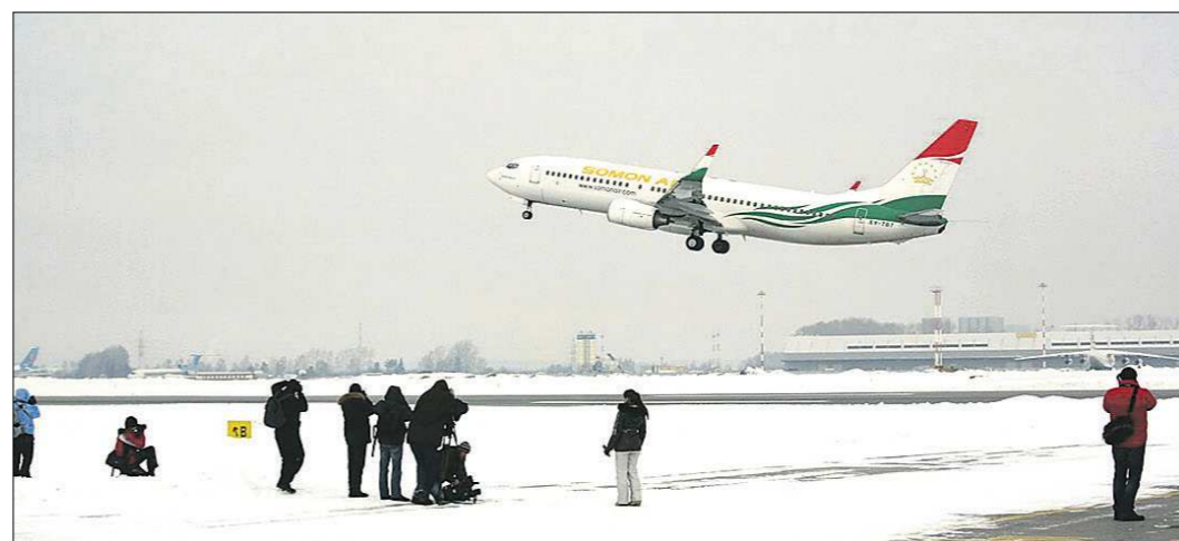
Первый споттинг в Кольцово прошёл в марте прошлого года. Часте всего подобные мероприятия аэропорты проводят с целью бесплатной саморекламы

— Нет, не принесёт, особенно при замкнутом, чанном цикле выщелачивания. Поэтому и сказала в начале нашего разговора, что неразумно «бастовать» против новых производств. Растворение золота цианидом натрия — не прихоть золотодобытчиков, сегодня можно успешно добывать этот драгметалл в основном только с использованием такой технологии. Безусловно, как показывает мировая практика, стопроцентно застраховаться от аварийного сброса в окружающую среду невозможно даже при использовании самых совершенных технологий. И способы для защиты от таких ядов найдены.