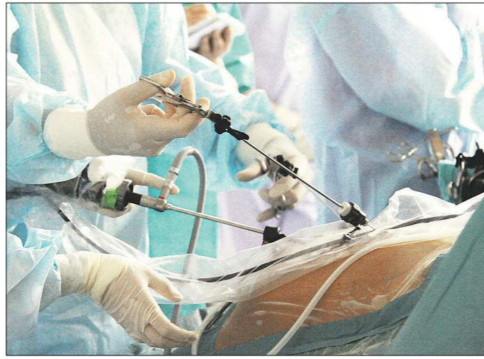
После использования таких инструментов на теле пациента практически не остаётся следов