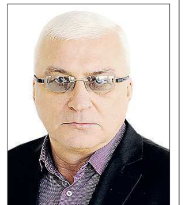
Александр Новокрещёнов прошёл путь от рядового милиционера до главного судебного пристава региона

В воскресенье отпраздновал 55-летие депутат Законодательного Собрания Свердловской области Александр НОВОКРЕЩЕНОВ. В разные годы он был главным судебным приставом Челябинской и Свердловской областей.