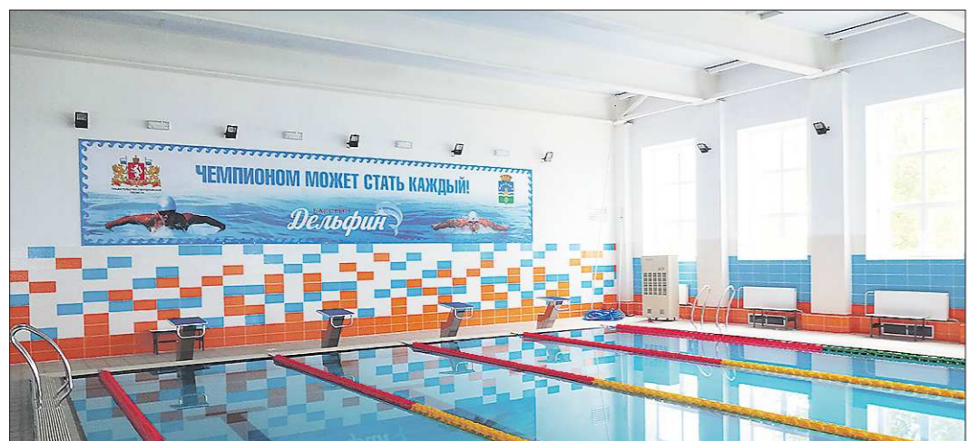
Изяны в гидроизоляции, выявленные поначалу, строители устранили. Теперь вода из чаш арамильского бассейна нигде не утекает. Но плавать в нём горожане пока не могут