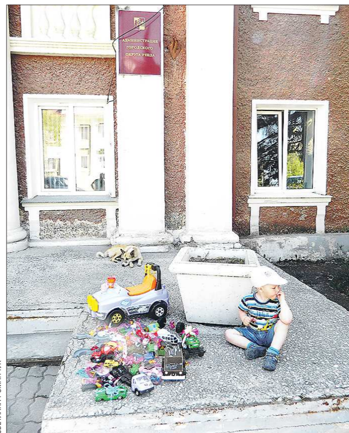
Поиграть с машинками на крыльце горадминистрации не успели возможности маленькие ревдинцы