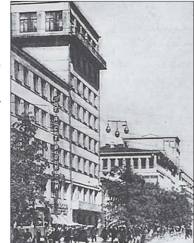
А вот так выглядел «Гастроном №5» в 1963 году

80 лет назад (в 1934 году) в Свердловске на углу проспекта Ленина и улицы Толмачёва открылся гастроном, ставший позже «Гастрономом №5» — одним из символов столицы Урала.