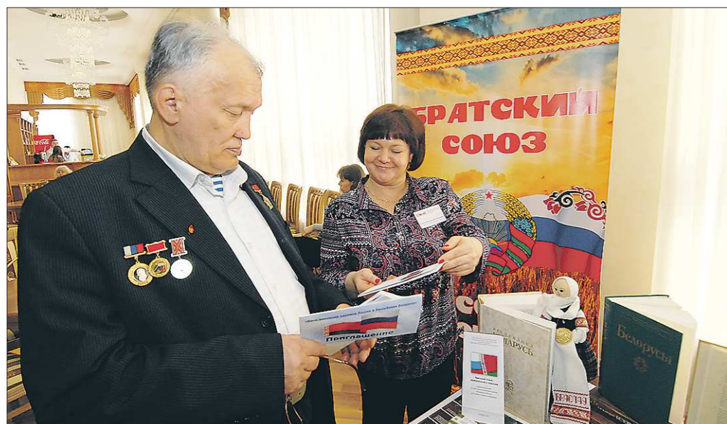
Гостям понравилась и организованная Свердловской областной межнациональной библиотекой выставка белорусских книг