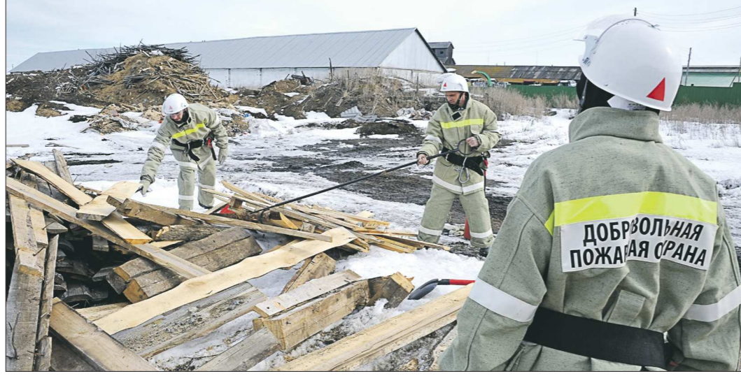
Добровольцы из белоярского села Некрасово работают пока не за деньги, а потому что – патриоты

Тут, кстати, чистота эксперимента была соблюдена: куда едем, никто в машине, кроме меня, не знал, никого заранее никто не предупредил. Да и я просто наугад назвал первое попавшееся по дороге село, в котором (на ходу выяснил)