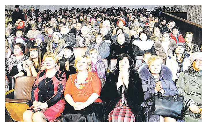
Зал деевского Дома культуры давно не собирал столько гостей

ГОСУДАРСТВЕННОЕ БЮДЖЕТНОЕ УЧРЕЖДЕНИЕ СВЕРДЛОВСКОЙ ОБЛАСТИ «РЕДАКЦИЯ ГАЗЕТЫ "ОБЛАСТНАЯ ГАЗЕТА"». ОБЩЕСТВЕННО-ПОЛИТИЧЕСКОЕ ИЗДАНИЕ