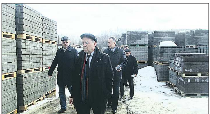
На выездном совещании в Новоуральске горнозаводские мэры познакомились с возможностями малых предприятий, работающих в строительном бизнесе

— Сейчас минприроды предлагают внести изменения в постановление правительства, чтобы исключить из границ заказника земли населённых пунктов. Инвесторы продолжают работу не хотят, да и жители в растерянности — там же 800 человек живут. И они, получается, «вне закона», — добавила замглавы.