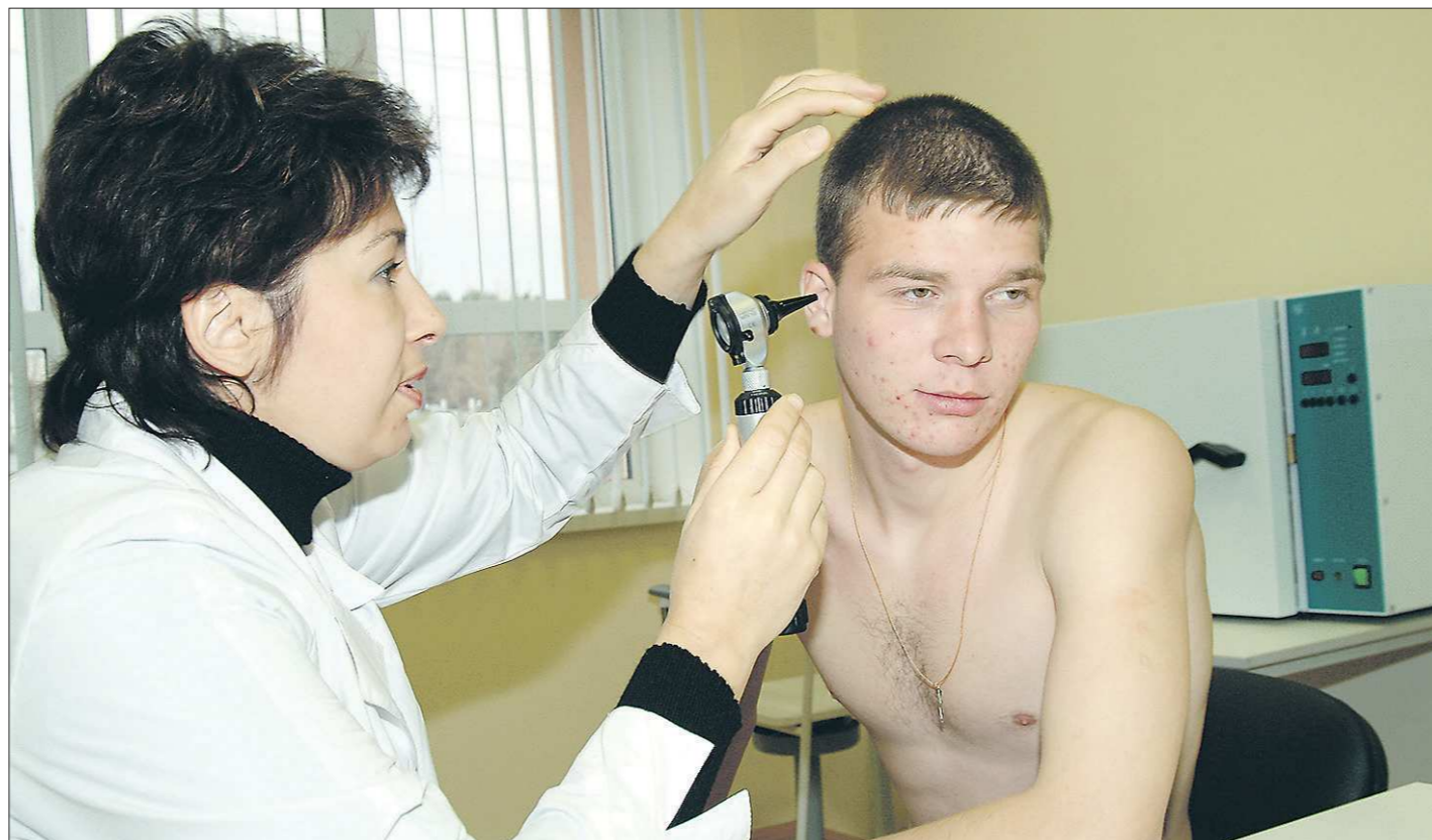
Для определения годности призывников к армейской службе в Свердловской области создано 48 медицинских комиссий