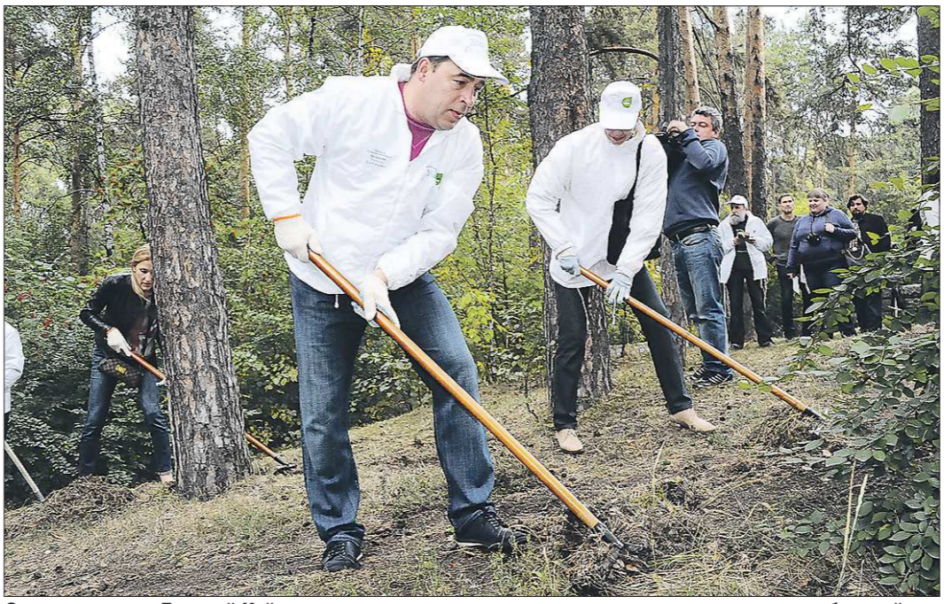
Свердловчанам Евгений Куйвашев уже запомнился не только как чиновник, но и как обычный человек, который запросто может пройтись по улицам без охраны или взять в руки грабли...