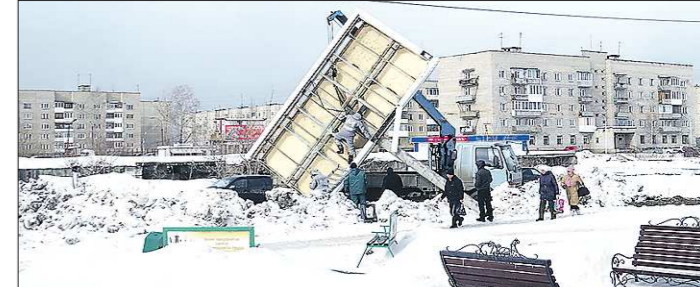
Сотрудники рекламной студии «Модерн» демонтируют щит на улице Ломоносова в Нижней Салде