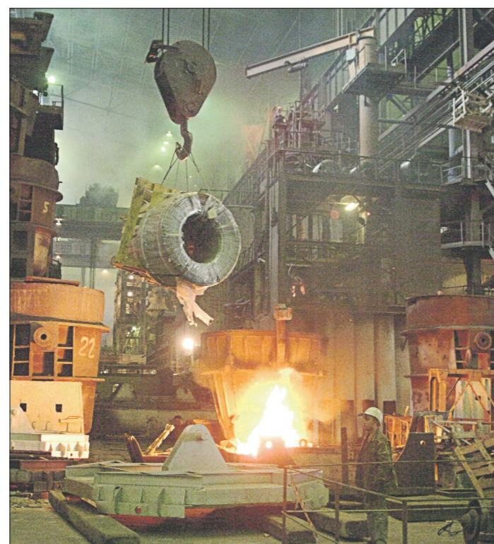
От удешевления рубля продукция наших металлургов станет более конкурентной