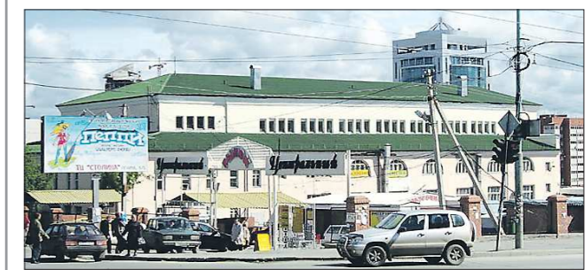
Так выглядел Центральный рынок в 2007 году, незадолго до сноса