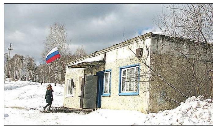
Это с виду неказистое здание стало «сердцем» посёлка Чашино — здесь будут располагаться все социально значимые службы