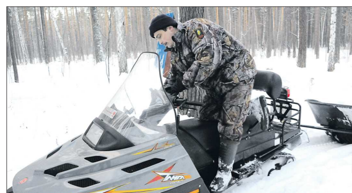
В Свердловской области 31 лесничество, свыше 15 миллионов гектаров лесных угодий, вести охрану такой площади непросто