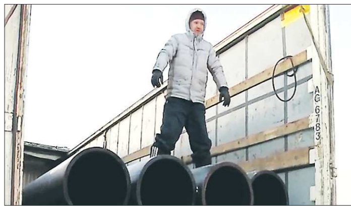
Новую ветку водовода Камышлов — Сухой Лог тянут 20 человек и 4 единицы техники