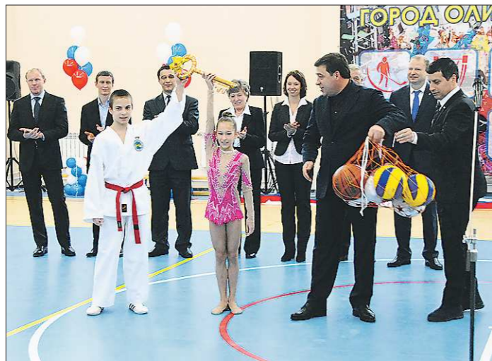
Помимо собственного нового ФОКа, каменские школьники получили от властей и новое оборудование со спортивным инвентарём

Совсем недавно, во второй половине 2013 года, новые ФОКи были открыты в посёлке Рефтинский (ледовый комплекс «Рефт-арена»), и в Чкаловском районе Екатеринбургa. Теперь очередь дошла до Каменско-Уральского. Евгений Куйвашев, вручая юным спортсменам символический ключ от комплекса, пожелал, чтобы воспитанники этого ФОКа в конечном счёте достигли высших результатов — побед в Олимпийских играх. В первой половине года здесь будут проходить уроки для учеников школы № 35, после обеда в тренажёрном и спортивном залах будут заниматься юные спортсмены, а вечером ФОК будет открыт для взрослых.