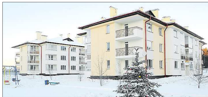
В первой очереди загородного посёлка будут жить 146 семей

Лес, тишина, воздух, добрый запах хвои, а недалеко — Исетское озеро. Посреди всей этой загородной идиллии — светлые трёхэтажные дома, в каждом — по три десятка квартир. За ними — ещё нештукатуренные серые коробки таунхаусов и коттеджей. Всё это — загородный посёлок Золотая Горка под Среднеуральском, который вчера получил официальное «добро» на заселение.