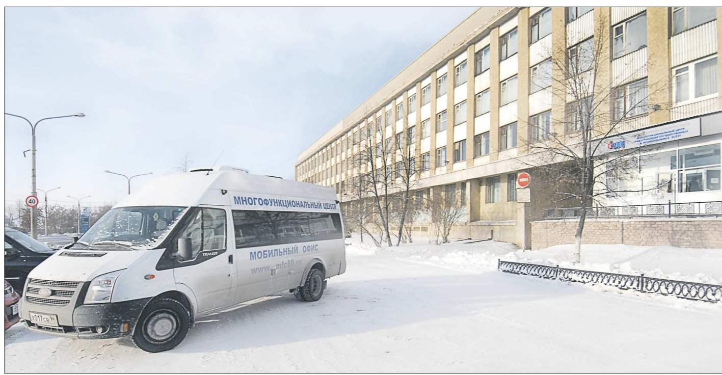
Синарский многофункциональный центр располагает и мобильным офисом