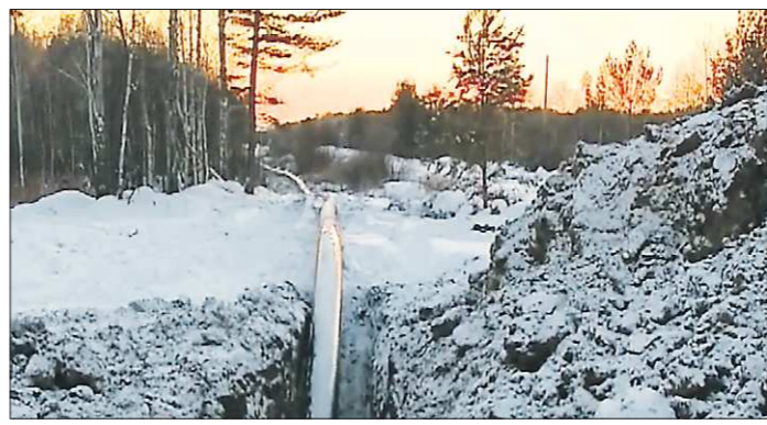
Сейчас меняют 3,5 километра «совсем никудашных» труб, а летом предстоит заменить все 7 километров проблемного участка. Общая длина водовода — 40 километров