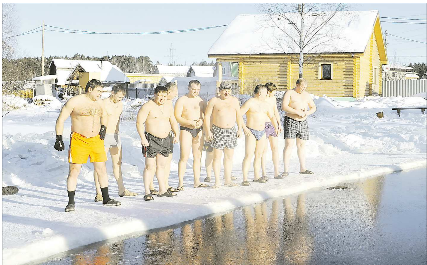
Моржовая «гвардия». А на термометре, между прочим, минус тридцать