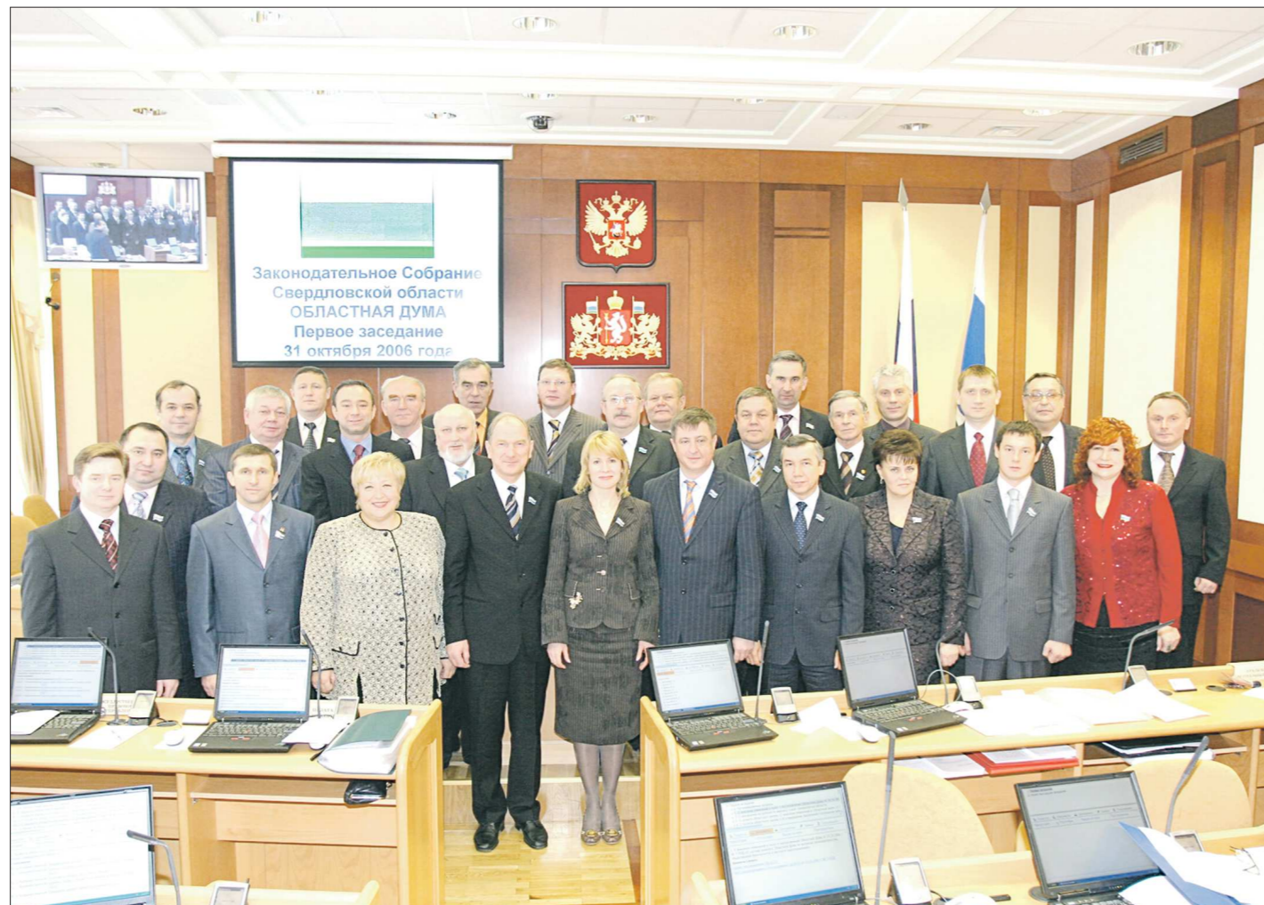
31 октября 2006 года областная Дума Законодательного Собрания собралась на своё первое заседание после парламентских выборов, состоявшихся 8 октября