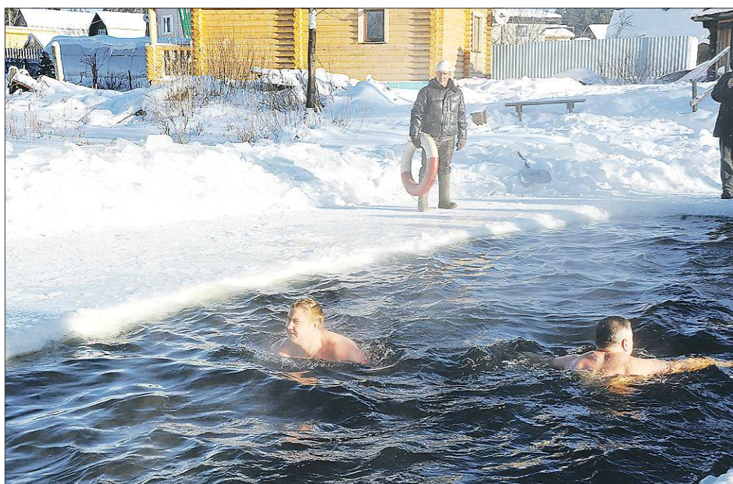
Екатеринбургские любители зимнего плавания отметили на территории коллективного сада «Шувакиш» День мужика. Полтора десятка членов клуба «Белый медведь» — закалённых мужчин самых разных профессий — устроили заплыв в ледяной проруби в тридцатиградусный мороз, доказав всем: человек выше обстоятельств. Была бы воля. Были бы мужики...

«Белый медведь» устроил День мужика с заплывом моржей