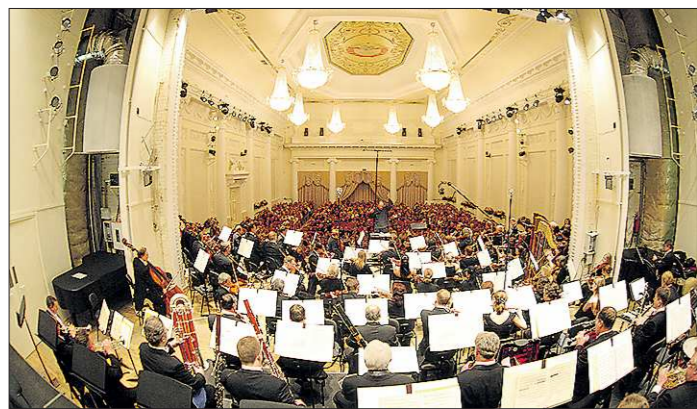
Виртуальные залы филармонии дадут возможность слушателям отдалённых районов страны увидеть выступления лучших российских и мировых коллективов