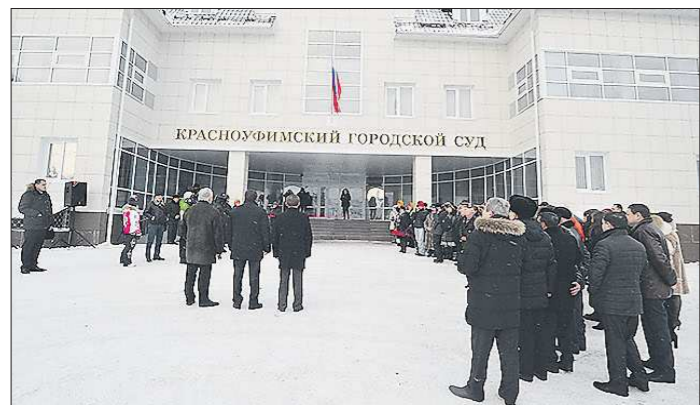
Новое здание суда по площади почти в три раза больше старого