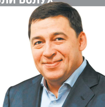
Евгений КУЙВАШЕВ, губернатор Свердловской области