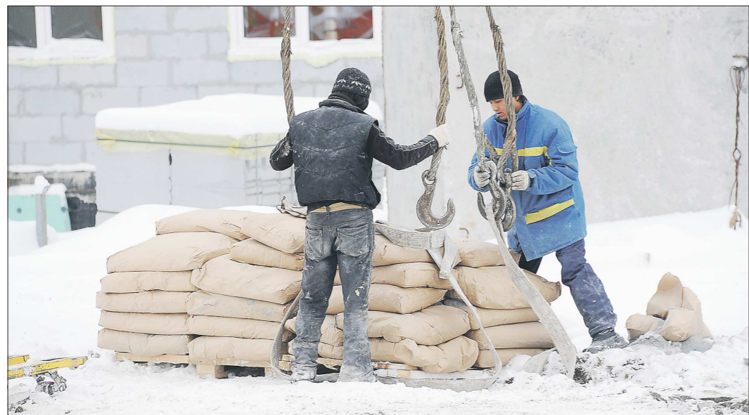
На стройках области сотни вакансий каменщиков, бетонщиков, стропальщиков

Потому что есть такой неприятный, но объективный фактор, как территориальная