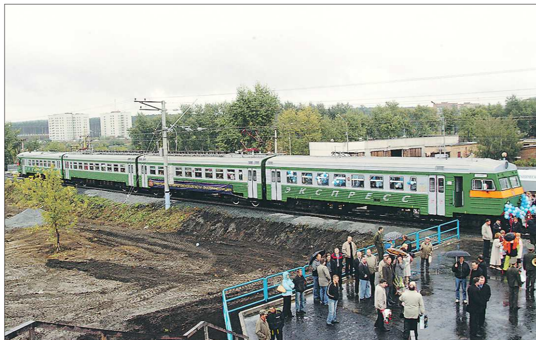
Свердловская пригородная компания сокращает количество электропоездов. Теперь их — ранних утренних и поздних вечерних — станет на 24 меньше. Останется 233