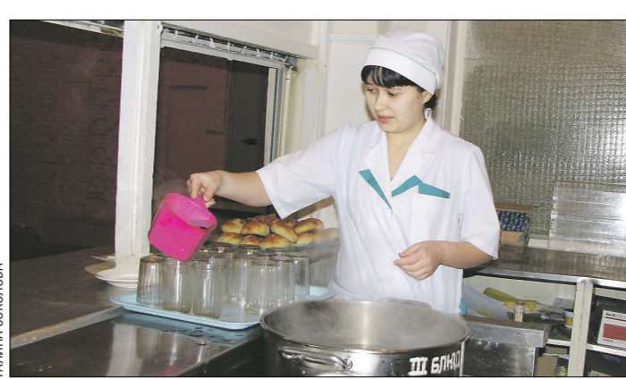
Ещё недавно учебный день в школе №85 начинался с горячего завтрака, который детям готовили сотрудники муниципального комбината продовольствия, питания и услуг