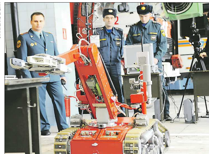
Своего умного механического помощника — робота-разведчика — новоуральские спасатели ласково называют Робертом