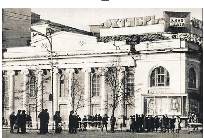
«Октябрь» славился прежде всего стереофильмами. Так как подобных фильмов выходило немного, одна и та же картина могла идти несколько месяцев...

В 1847-м театр открылся комедией «Приемный» и водевилем «Дезертир». Кстати, эти жанры наряду с мелодрамами в те времена были самыми популярными... Но театр брался и за серьезные вещи. В 1887 году, например, поставили «Золотопромывальники» Мамина-Сибиряка.