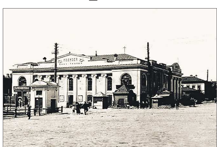
В 1885-м театр получил электрическое освещение. Газета «Екатеринбургская неделя» писала об этом: «...Электрический свет, потухая внезапно, заставлял нервных дам вскрикивать»