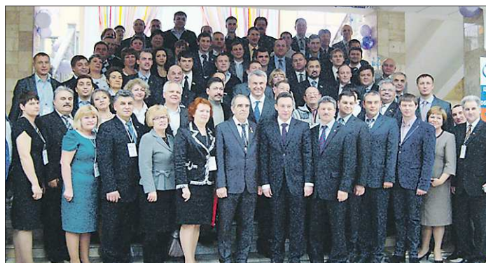
Название и символ движения есть, а гимна пока нет. Один из делегатов предложил провести конкурс на лучшую песню, которая станет гимном человеку труда