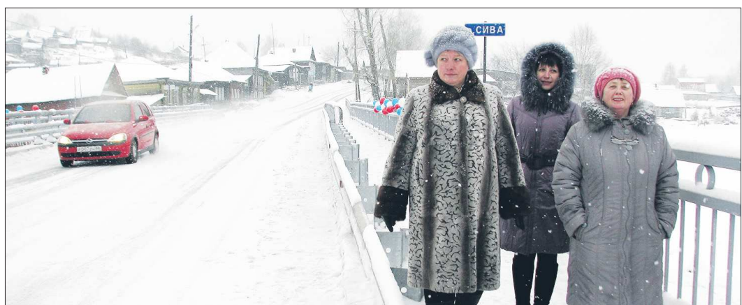
Дорога через Сиву всегда была весьма оживлённой. В старину на однопутной переправе всем хватало места, но для современной логистики такой мост совершенно не подходил