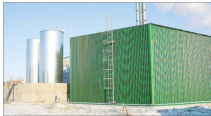
Новая котельная работает в автономном режиме. По прогнозам специалистов, за один отопительный сезон она может дать экономии порядка семи миллионов рублей

+/- — рост / падение по отношению к предыдущему показателю