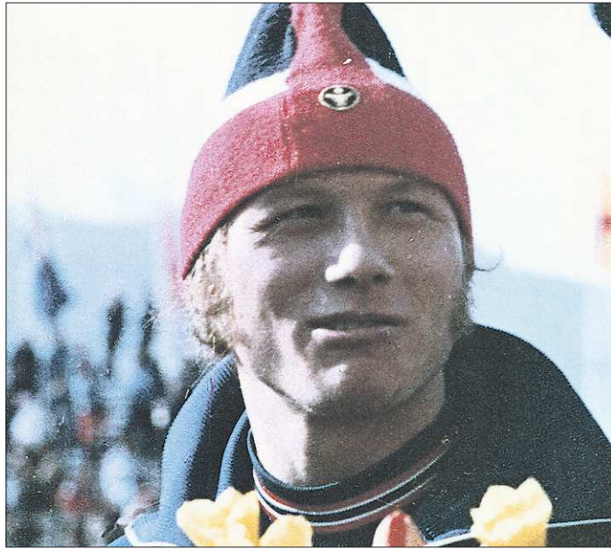
Евгений Куликов — единственный из уральских спортсменов, поднявшийся в Лейк-Плэсиде на олимпийский пьедестал

Несмотря на то что зимние Игры 1980 года были уже тринадцатыми по счёту, здесь тоже нашлось место событиям, происшедшим впервые. Не бывало прежде такого, чтобы претенденты на право проведения зимних Игр снимали свои кандидатуры ещё до голосования. Впервые соревнование проходило с использованием искусственного снега. Главным героем стал американский конькобежец Эрик Хайден, завоевавший пять золотых медалей. Сенсационную победу в хоккейном турнире одержала составленная из игроков студенческих лиг сборная США. Финальный матч хозяев со сборной СССР вошёл в историю под романтическим названием «Чудо на льду». Самый драматический эпизодом Игр в Лейк-Плэсиде следует признать лыжную гонку с раздельным стартом на 15 километров, где швед Томас Вассберг на одну сотую секунды (самый маленький отрыв в истории Олимпиад) опередил финна Юху Мието. После этого учёт