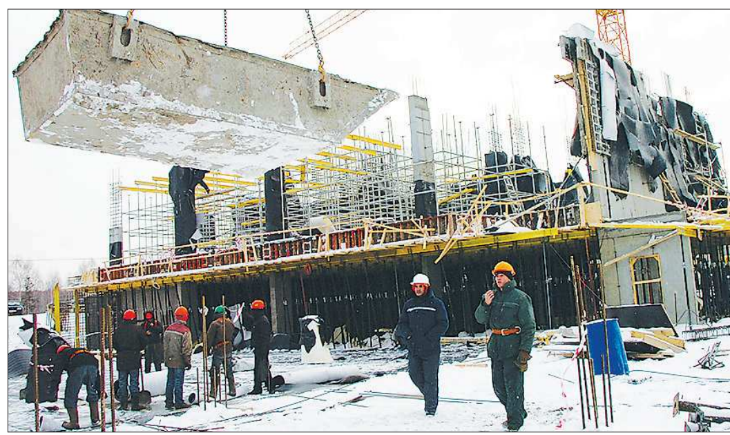
Только в 2014 году на стимулирование жилищного и социального строительства из всех источников финансирования поступит 24,4 миллиарда рублей