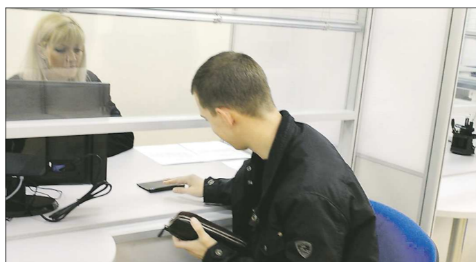
Справки по различным вопросам можно получить в одном окне за считанные минуты

Позвело молодых россиянам, которые только начинают свою трудовую деятельность, тем, за кого работодатель впервые перечислит деньги в Пенсионный фонд, начиная с января 2014 года. Им дано пять лет, чтобы вникнуть в суть вопроса, просчитать варианты и определиться с выбором. К тому же пояснено, что если человек начал работать до 18 лет, то с выбором, куда направить шесть процентов – на накопительную или страховую часть пенсии, придётся повременить до того, как ему исполнится 23 года.