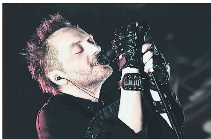
Вадим Самойлов на летнем «Старом новом роке» представил свою сольную программу. Изюминкой предстоящего фестиваля станет его творческая встреча со слушателями

— Наш менталитет, наша культура, традиции — всё сложилось именно благодаря заводам и горной промышленности, — говорит писатель. — Поэтому моя книга и посвящена тому, как горнозаводское дело повлияло на людей, которые живут на Урале. Здесь главная ценность — труд. У нас испокон веков то был самым уважаемым человеком? Мастер, который мог сотворить диковину. Время изменилось, но ценности — нет: именно поэтому Екатеринбург никогда не станет Москвой.