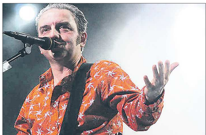
Владимир Шахрин впервые за историю фестиваля проведёт мастер-класс: он расскажет молодым музыкантам, как представить своё искусство широкому слушателю, не уезжая в столицу