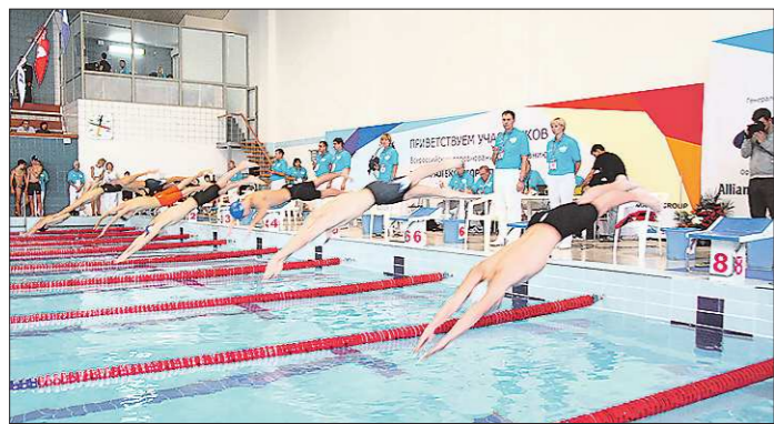
В соревнованиях принимают участие 436 спортсменов: 64 команды из 56 субъектов России и зарубежные юноши и девушки