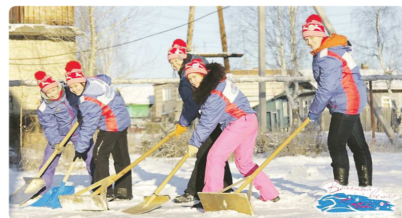
Ежедневно на протяжении недели отряды выкладывали свои фотоотчёты в группе в социальной сети. На фото – студенты из отряда «Вольный ветер»

В эти дни в шести муниципалитетах области работает молодёжный десант – 120 студентов из 11 уральских вузов. Они рассказывают школьникам о студенческой жизни, помогают по хозяйству пенсионерам, проводят в селах концерты и спортивные соревнования.