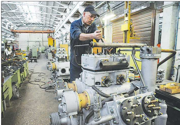
В годы войны на заводе делали легендарную «катушку», сейчас — уникальные мембранные компрессоры. Такие могут изготовить только на нашем УКЗ и во Франции