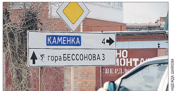
Накануне Сочинской олимпиады и Бесёновка становится «олимпийским объектом»