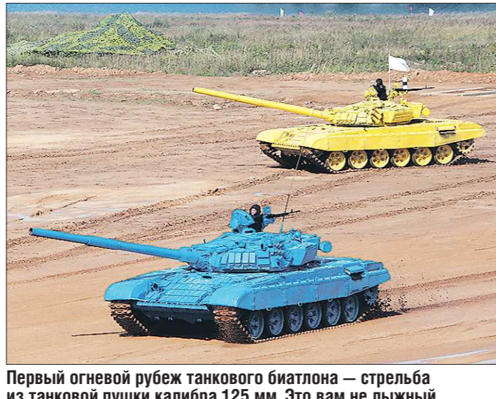
Первый огневой рубеж танкового биатлона — стрельба из танковой пушки калибра 125 мм. Это вам не лыжный биатлон, где используют патроны калибра 5,6 мм