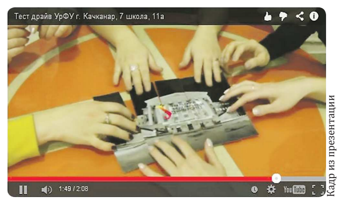
Двухминутный ролик качканарской школы № 7 вошёл в число финалистов. Школьники отличились интересным сюжетом: несколько подростков находят у себя составные части открыток с изображением Уральского федерального университета. И, только встретившись, могут сложить всё воедино

Подведены итоги отборочного этапа образовательного проекта «Тест-драйв» Уральского федерального университета. 383 школьника с Урала и из стран ближнего зарубежья на два дня станут студентами.