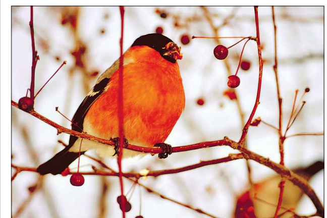
В старину считали, что увидеть снегиря – к любви и радости. Орнитологи выбирали снегиря «птицей года» в 2008-м. Без снегиря зима – не зима