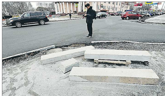
Плохие дороги не только повышают аварийность, но и снижают уровень безопасности пешеходов

— Нужна серьёзная экспертиза проектов: внимание