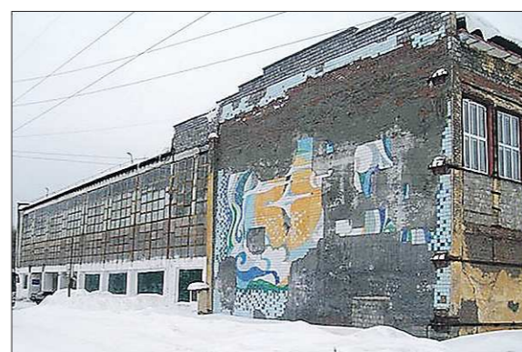
Сегодня спорткомплекс выглядит устрашающе и снаружи, и внутри. Однако баранчинцы верят, что смогут вернуть ему достойный облик

Куйвашеву было дано поручение взять на контроль решение данного вопроса и о результатах доложить Президенту.