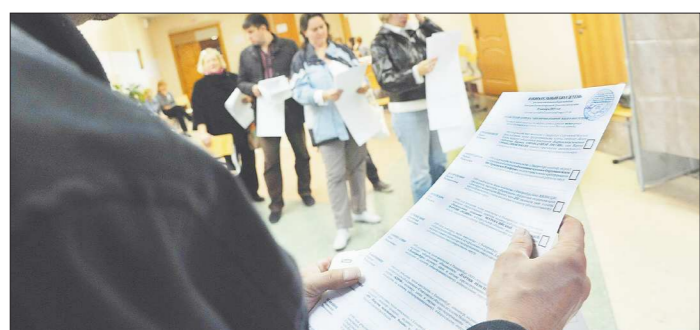
Избирательный бюллетень скоро, возможно, изменится