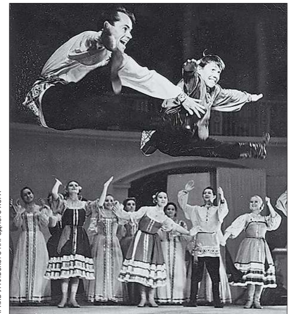
Хор был создан на базе самостоятельных (!) сельских хоров. Нынче только историки помнят об этом: все годы хор демонстрирует высочайший профессионализм (на снимке –1968 г., Москва, Зал им. Чайковского)

— Сегодня гастрольные выступления российских артистов организуют коммерческие концертные агентства, а им народные коллективы не интересны. Существующий Союз концертных организаций России тоже занят в основном академической музыкой. Нужна структура, подобная прежнему «Росконцерту», нужна господдержка. Иначе народное искусство так и не будет доходить до народа.