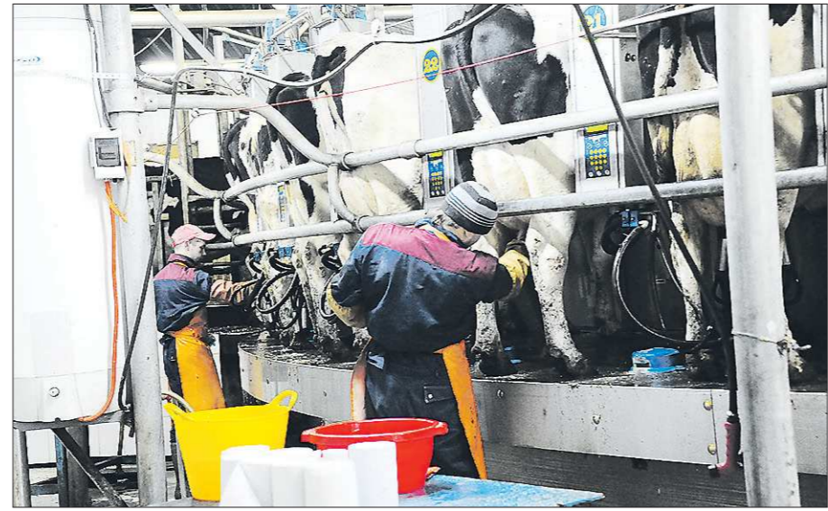
За смену два дояра успевают продоять на «карусели» 1100 коров. Производительность — на уровне лучших мировых ферм

День-икс — погашение задолженности — переносился уже несколько раз. Последний срок — 1 декабря текущего года, после которого книжки МДП должны быть отменены на всех таможенных России, как и сотрудники таможенного ведомства. Но учитывая, что автоперевозчик — это не только бизнес, но и рабочие места, правительство страны вновь пошло навстречу транспортным компаниям. На днях вице-премьер Игорь Шувалов принял решение вернуть этот единый документ для международных грузооператоров во всех регионах страны. Но если поиски компромисса между таможенной службой и её должником — АСМАП — не увенчаются успехом, для выборов нового гарантийного объединения международных перевозок будет объявлен конкурс.