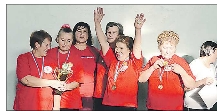
Победители соревнований — команда «Щелкунчик»

ГОСУДАРСТВЕННОЕ БЮДЖЕТНОЕ УЧРЕЖДЕНИЕ СВЕРДЛОВСКОЙ ОБЛАСТИ «РЕДАКЦИЯ ГАЗЕТЫ "ОБЛАСТНАЯ ГАЗЕТА"». ОБЩЕСТВЕННО-ПОЛИТИЧЕСКОЕ ИЗДАНИЕ