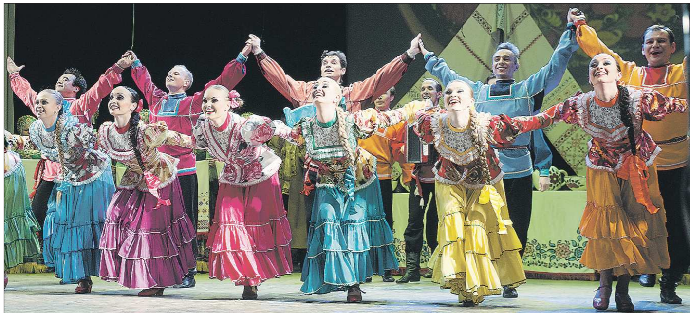
От престижных сцен в Дании, Англии, Норвегии до экзотических площадок в Мексике, Эфиопии, Китае, Венесуэле Уральский народный хор пропагандировал лучшие образцы русского фольклорного искусства. В золотом фонде коллектива – уральские народные песни «Дубровушка», «Куманёк», «У присла», а также хореографические миниатюры «Кадриль старого Невьянска», «Бабрыня», «Горенка», «Крутихинские переборы», «Ирбитская ярмарка»

Жаль несусветная, что народное исполнительское