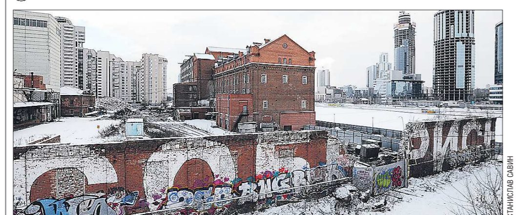
В Екатеринбурге начался снос мукомольного завода на улице Челюскинцев. На освободившейся площадке вырастет многофункциональный жилой комплекс бизнес-класса (см. «ОГ» от 5 июня сего года). «В живых» застройщики обещали оставить лишь два старых здания — мастерскую внутри квартала и Симановскую мельницу (на фото в центре). Демонтаж завода продлится до августа 2014 года