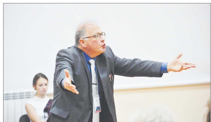
Павел Любимцев прославился «Путешествиями натуралиста» (НТВ, Первый канал, Культура). На Уральском медиафоруме он продемонстрировал, что неплохо разбирается ещё и в людях

Евгений Куйвашев поблагодарил всех земляков, которые своим трудом, знаниями и энергией сделали возможным участие столицы Урала в мировом состязании городов, и мы все вместе заняли достойное место. Таково мнение в истории Среднего Урала ещё не было. Мы многому научились, почувствовали свою мощь и силу. Добрым словом глава реги-