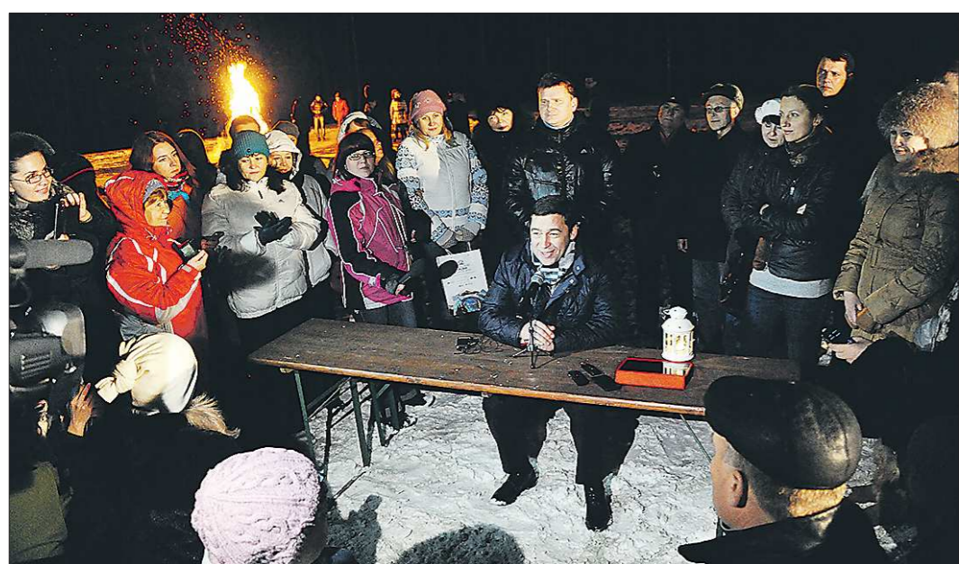
«Область смотрит на губернатора»