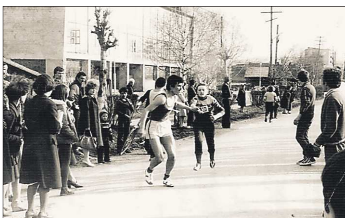
Со дня своего открытия «Синегорец» был центром спортивной жизни посёлка