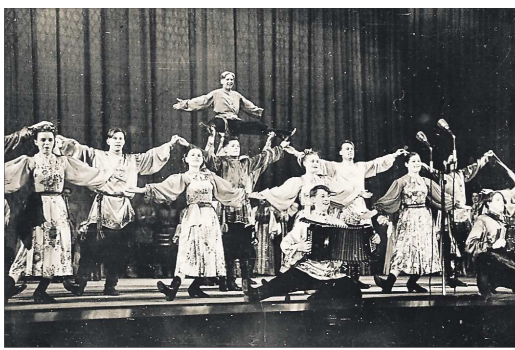
«Большой уральский перепляс», 1940-е годы. Этот снимок и запечатлённое на нём — из разряда достояний России. Летом 1943 года, вопреки тяготам войны, Свердловский обком ВКП(б) принял постановление «О создании Уральского народного хора русской песни». «В целях широкой пропаганды русской народной песни и пляски, богатого уральского фольклора», — было записано в нём. Первая программа появилась к концу 1943-го. А вчера Уральский академический русский народный хор большим юбилейным концертом отметил своё 70-летие