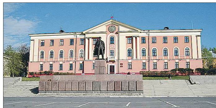
Дума Новоуральска не устраивает схема власти «о двух головах»