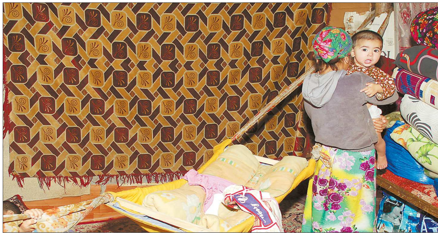
Разве можно допустить, чтоб такой симпатичный малыш замёрз уральской зимой?