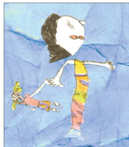
Героиня фильма Риты Квашниной «Морская кукла»

От всех преобразований в конечном итоге выиграют больные. Оттуда от врача, уважаемого, живущего достойной жизнью, незамотанного работой, будет, естественно, больше. Новое оборудование станет ему существенным подспорьем. В отремонтированных уютных клиниках сильно улучшится настроение пациентов, оторванных от привычной домашней обстановки. Хорошее настроение способствует скорейшему выздоровлению человека. Чего же ещё? Ведь этого и добиваемся.