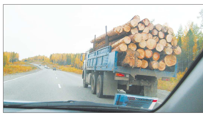
Запасы леса Свердловской области равны объёмам аналогичных запасов Финляндии, но мы в основном торгуем сырьём, а финны – готовыми изделиями