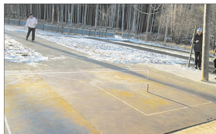
Пример городошного фокуса. Задача: выбить два лежащих по краям городка, не задев центральный стоящий. Бита закручивается так, что, сбив одним концом первый городок (красный крестик), отгибает центр и другим концом (по стрелке) летит ко второму городку