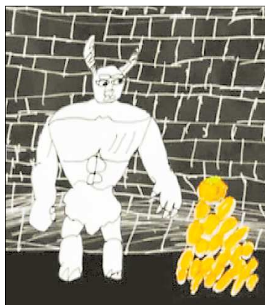
А это уже герои фильма Максима Щербакова «Тайна лабиринта»