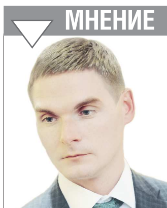
Андрей СОБОЛЕВ , министр международных и внешнеэкономических связей Свердловской области