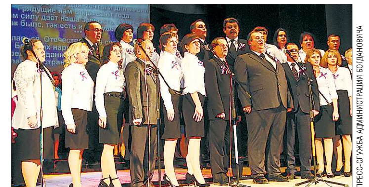
Хор администрации Богдановича исполняет гимн России в стиле рок