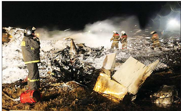
В такой момент никто, конечно, не спрашивает, застрахован объект или нет. Первым делом надо спасти тех, кого спасти ещё возможно

С 1 января 2012 года в России вступил в силу Федеральный закон № 225-ФЗ «Об обязательном страховании гражданско-ответственности владельца опасного объекта за причинение вреда в результате аварии на опасном объекте». Суть его заключается в том, что владельцы опасных объектов несут ответственность за причинение вреда здоровью, жизни и имуществу, а также за нарушение условий жизнедеятельности людей. Причём это только перед работниками этих самых объектов, но и перед всеми остальными гражданами, которые могут пострадать в результате аварии на опасном объекте.