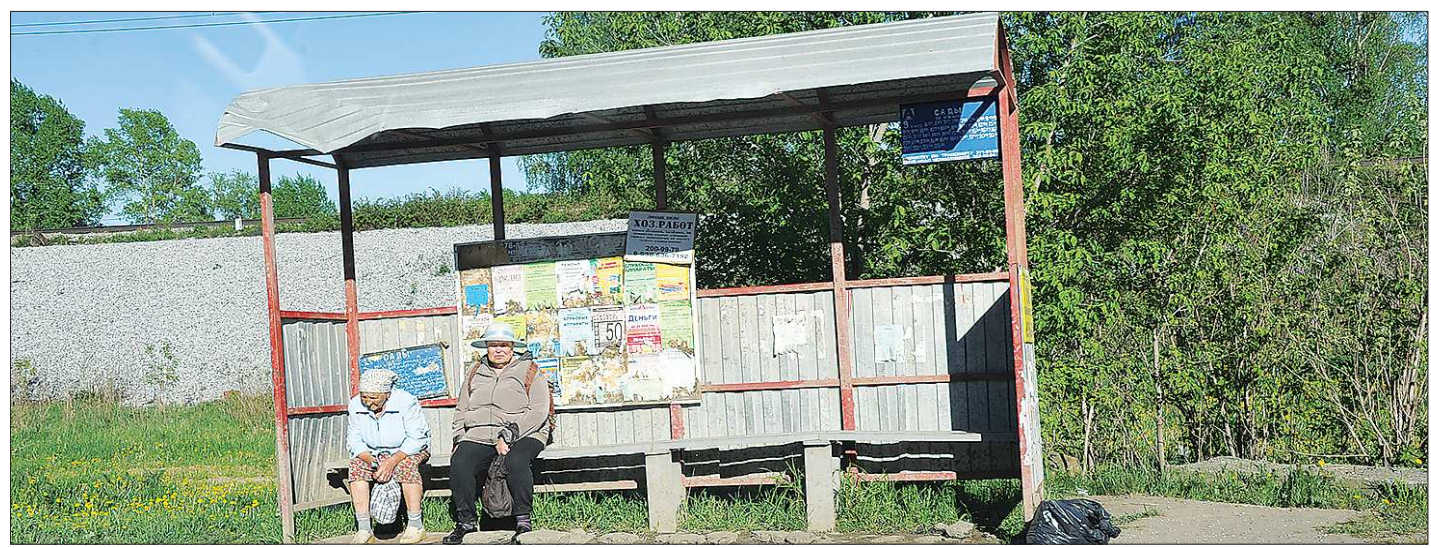
Для жителей отдалённых сёл поездки в соседний муниципалитет превращаются в роскошь