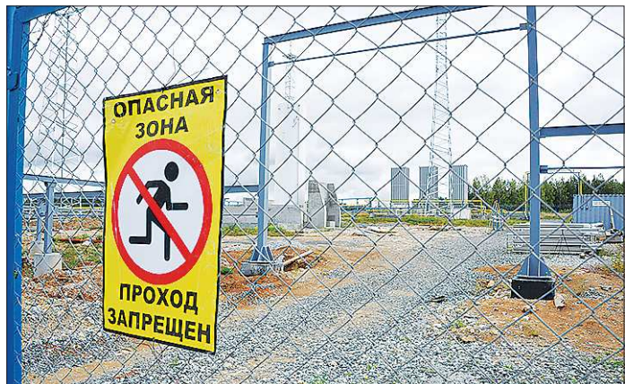
Тысячи людей работают на опасных предприятиях в любом регионе страны

Вы не замечали, что, проходя мимо стройки, мы с какой-то поры стали с опаской коситься на башенные краны или в подъезде прислушиваться к скрипу подъёмного лифта? Можно, конечно, просто вздыхать «никто не застрахован» или «от судьбы не уйдёшь», но лучше знать, что в случае ЧП есть шанс хоть как-то компенсировать свои потери.