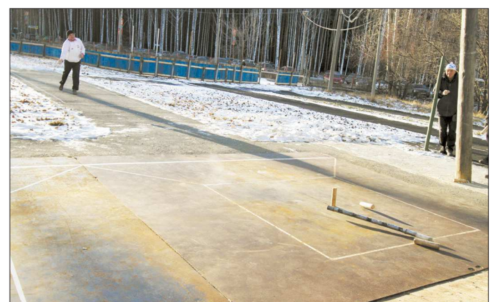
Пример городошного фокуса. Задача: выбить два лежащих по краям городка, не задев центральный стоящий. Бита закручивается так, что, сбив одним концом первый городок (красный крестик), отгибает центр и другим концом (по стрелке) летит ко второму городку