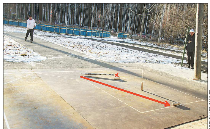
Пример городошного фокуса. Задача: выбить два лежащих по краям городка, не задев центральный стоящий. Бита закручивается так, что, сбив одним концом первый городок (красный крестик), отгибает центр и другим концом (по стрелке) летит ко второму городку