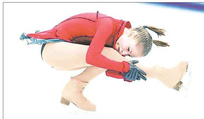
Юлия Липницкая: «Ужасный был прокат. Слава Богу, что по сумме двух программ осталась первой»