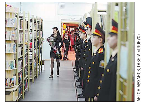
100-летний юбилей главная библиотека Серова отметила при полном параде

Поздравляющие сравнили библиотеку с «дамой начитанной и очень-очень почтенной». «Даме» к круглой дате преподнесли книгу, посвящённую 20-летию выезда советских войск из Афганистана, подарочный сертификат, телевизор, а также композицию от воспитанников музыкальной школы.