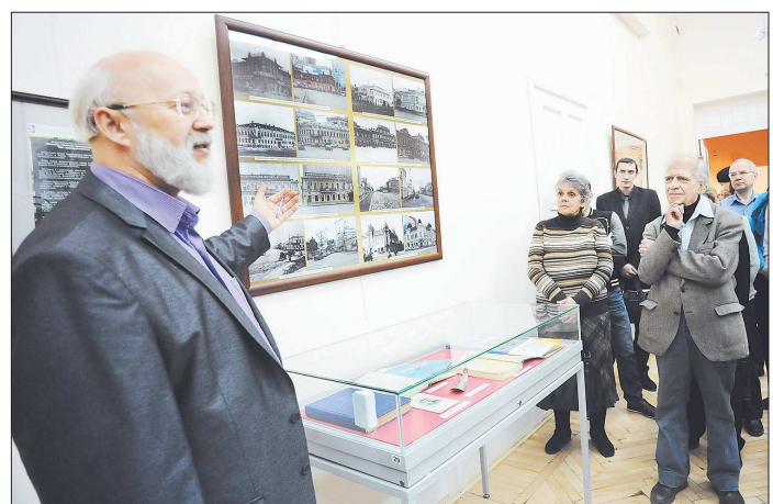
Музейные работники предоставили исторические документы и экспонаты, которые не сохранились в семьях предпринимателей