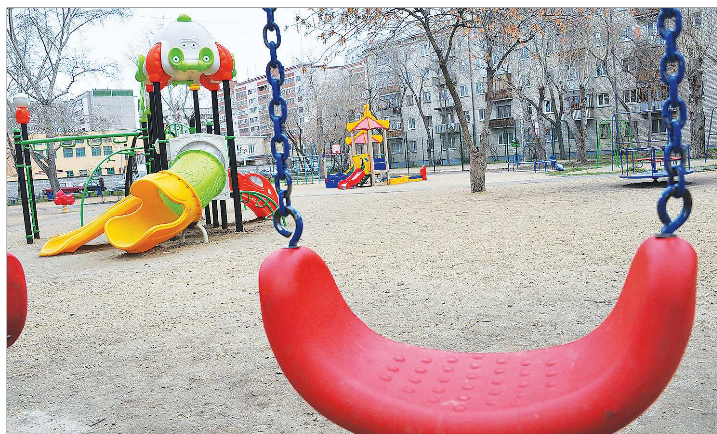
Адрес этой симпатичной детской площадки в Екатеринбурге – улица Заводская, 14. Милости просим!