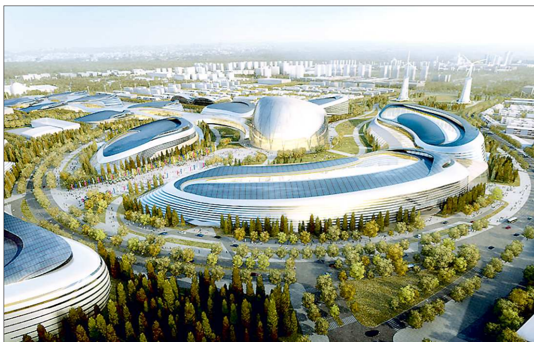
Так будет выглядеть выставочный комплекс ЭКСПО-2017 в Астане. Пока на этом месте — пустырь

Напомним, Россия поднялась на двадцать ступеней в традиционном рейтинге Всемирного банка (ВБ) и Международной финансовой корпорации «Doing Business», отражающем условия ведения бизнеса в стране, переместившись со 112-го на 92-е место. Комментируя этот факт председатель правительства РФ подчеркнул, что «при всём нашем достаточно спокойном отношении к рейтингам, тем не менее мы ориентируемся на тренды, которые существуют». Напомним, что Президент России Владимир Путин в майских указах 2012 года поставил задачу, чтобы к 2020 году наша страна вошла в первую двадцатку стран с благоприятными условиями для ведения бизнеса по рейтингу Doing Business.