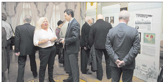
«Областная газета» для московских свердловчан — это окошко в родной регион