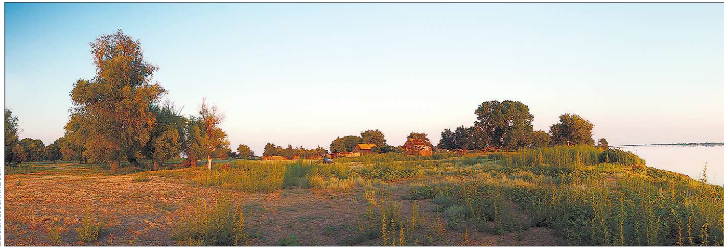
Ещё ряд заброшенных ивдельских посёлков ждёт очереди на официальное признание несуществующими. Если, конечно, в них не вернётся жизнь

Число «главных блогов» в уральских городах растёт не быстро, сейчас их не более десяти. Но у градоначальников, которые ими уже пользуются, отказываться от этого не спешат.