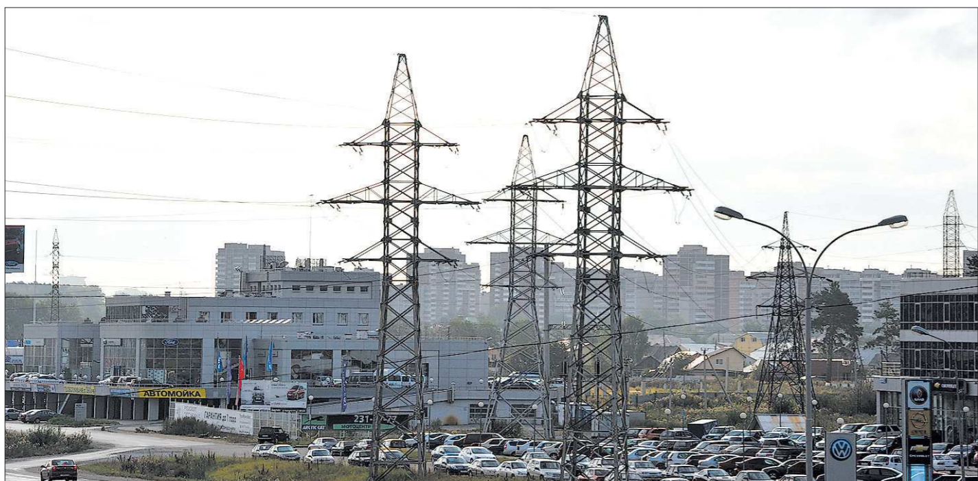
Срок подключения к энергосети к 2018 году должен сократиться с 281 до 40 дней