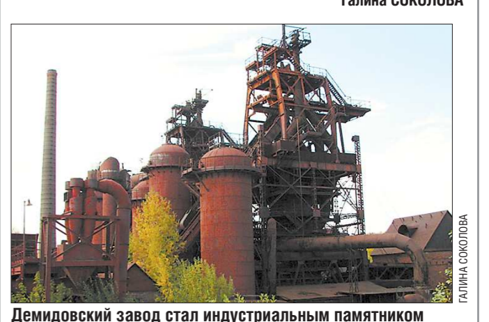
Демидовский завод стал индустриальным памятником

Получив «добро» от Петра I, Никита Демидов заложил сразу два завода на соседних речах — Тагиле и Вые. Один предназначался для переработки железных руд, другой — для медных. Первым закончили Выйский медеплавильный завод. Там и получили первый тагильский чугуна.