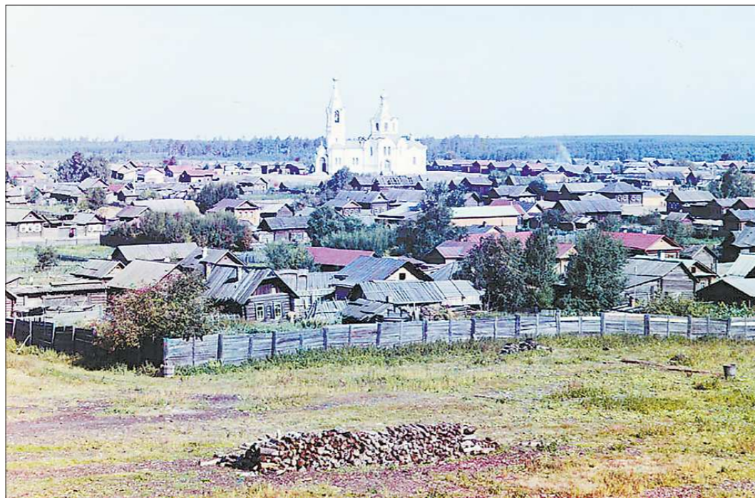
Вид на посёлок Верх-Исетского завода. Заречная часть. В центре снимка Никольская церковь (освящена в 1897 году). Она стояла на торговой площади (сейчас это территория «птичьего рынка»)

В 2013 году отмечается 150-летие со дня рождения Сергея Прокудина-Горского. В год столь солидного юбилея как не вспомнить, что осенью 1910 года пионер цветной фотографии в России, на полвека опередивший время, был в Екатеринбург. Благодаря ему мы сегодня можем увидеть в цвете исторические памятники, знаменитых людей, например, Шалапина и Толстого. А ещё — панорамы и виды крупнейших городов Российской империи. В том числе Екатеринбурга... Здесь Прокудин-Горский, по разным данным, пробыл с сентября по конец октября.