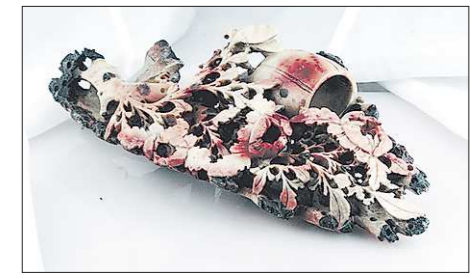
Китайские резчики создавали изделия из самых разных материалов: от бамбука до рога и янтаря