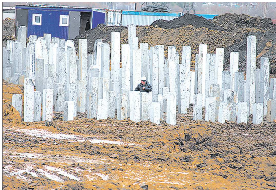
Под первый квартал района комплексной застройки «Солнечный» строители уже забивают свайное поле

Строители уверены, что дополнительную привлекательность новому району придаст соседство с тема-