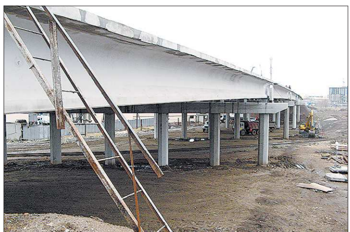
Верхнепышминский путепровод соединит улицы Ленина и Советскую

Возведение автомобильной развязки проходит в рамках областной целевой программы «Развитие транспортного комплекса Свердловской области на 2011–2016 годы». Окончание строительства запланировано на 2016 год, но при наличии необходимого финансирования заказчик и подрядчики готовы сдать объект к концу 2014 года. Вчера здесь продемонстрировали ключевой этап строительства: монтаж одной из последних балок полётного строения (весом почти 60 тонн). После установки всех двенадцати балок дорожные строители приступят к соединению стыков элементов сборных конструкций.