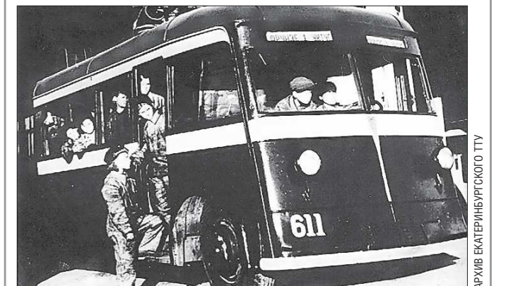
Выезд из гаража первого в Екатеринбурге троллейбуса. 1943 год