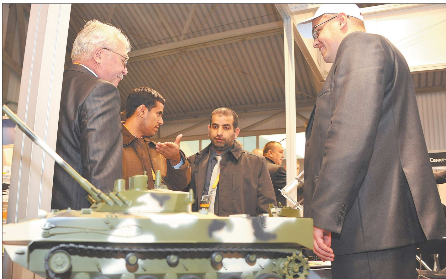
Выставка в Нижнем Тагиле — один из инструментов продвижения российской боевой техники на рынке вооружения

— До объявления результатов конкурса осталось всего ничего. Тут о шагах уже трудно говорить, конечный этап — это поездка руководителей заявочного комитета и Свердловской области в Париж, где будет назван победитель. Последняя работа по привлечению тех стран, которые могли бы проголосовать за нас, будет именно там.