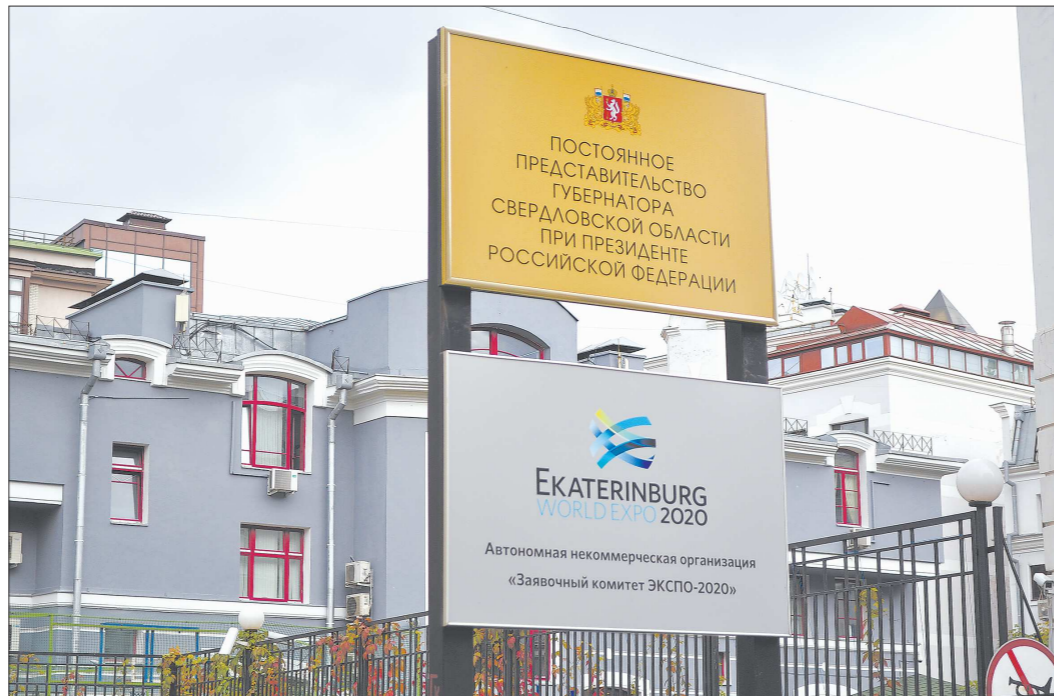
Резиденцию постпреда свердловского губернатора в Москве украшают две вывески. Вторая напоминает о заявке Екатеринбургa на ЭКСПО-2020

— Рабочий день начинается с обзора прессы, с получения информации о том, что происходит в Свердловской области и в России в целом. Мы каждый день проводим пятиминутку — совещание, где подводим итоги по выполненным заданиям, которые были даны