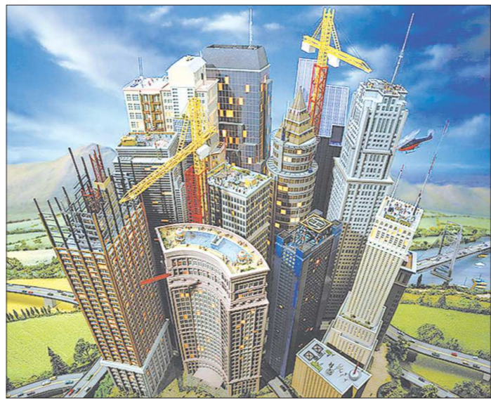
Для качественной жизни мало квартиры в небоскребе. Нужны уютный двор, спортивная площадка, больница, школа, магазины — в шаговой доступности, а также отсутствие дорожно-транспортных проблем