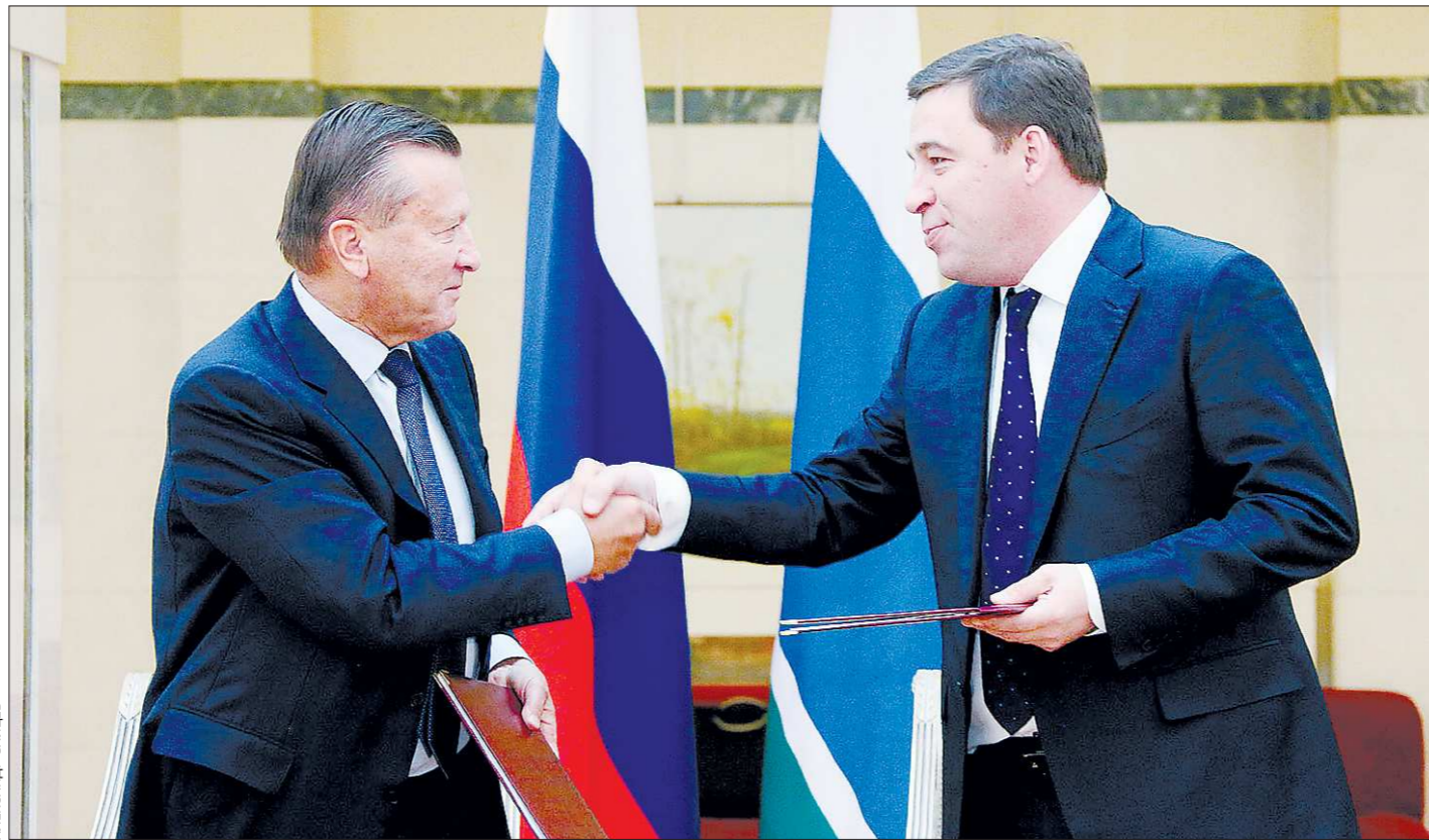
Виктор Зубков и Евгений Куйвашев запускают проект, который не только сделает газомоторное топливо более доступным для уральцев, но и обеспечит жителей нашего региона новыми, высокотехнологичными рабочими местами

Вчера Евгений Куйвашев подписал соглашение, способное сделать реальностью массовый перевод автомобилей с бензина и солярки на газ