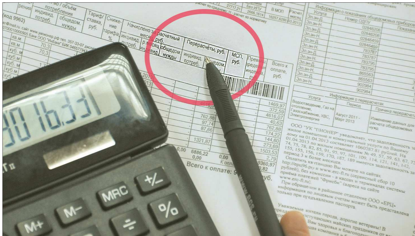
Перерасчёт за тепло можно потребовать за три последних года – в пределах срока исковой давности