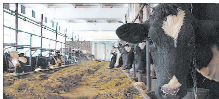
По производству молока Средний Урал занимает первое место среди регионов УрФО и десятое – в стране

пам роста поголовья свиней, и в первую двадцатку – по росту поголовья коров. В производстве мяса скота и птицы Средний Урал занимает 13-е место. Надо сказать, что в этом рейтинге оцениваются показатели за последние пять лет. И с 2007 года производство мяса в регионе увеличилось на 29 процентов.