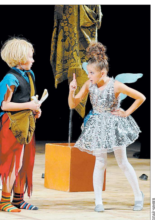
В Екатеринбурге стартовал IV Открытый фестиваль детско-юношеских любительских театров «Театральный перекресток 13». В программе — двенадцать спектаклей, которые смогут посетить более 4 000 зрителей

Сейчас сотрудники поселковой администрации каждый день приходят в здание детсада, следят за продвижением работ.