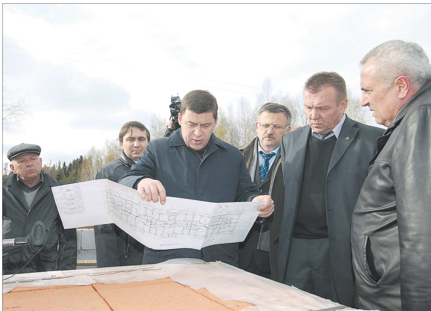
Евгений Куйвашев ознакомился с планом трёхэтажного дома, 30 квартир (из 39) которого будут отданы детям-сиротам. К сожалению, проблему это не решит – в очереди на получение жилья стоят более 300 семей, входящие в разные категории льготников

Вероятно, наши читатели помнят то помпезное мероприятие, когда на сегодняшний день уже бывшие полпред Президента РФ в УрФО Николай Винниченко, губернатор Свердловской области Александр Мишарин и архиепископ Викентий в мар-