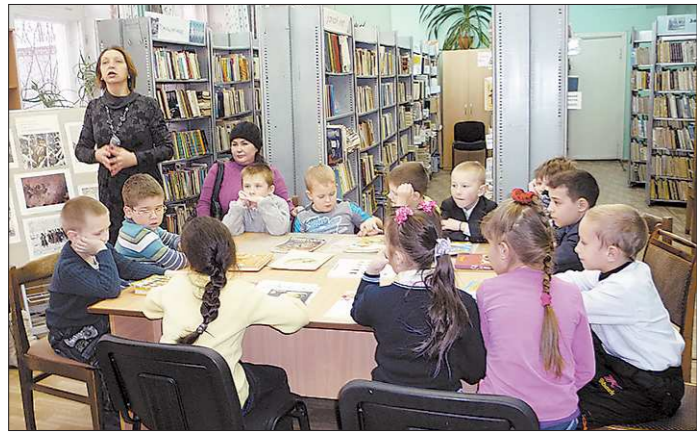
Одна из немногих профсоюзных библиотек в области сохранилась в Верхней Салде. В её книжном фонде — 160 650 экземпляров. Сюда поступают 85 периодических изданий