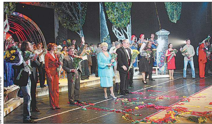
Сочи проводил уральских артистов овациями и дождём... из цветов

Поэзия — искусство самодостаточно. Сильно сказанное слово окажется сильнее десятикратного простого слова, пусть даже сопровождаемого действием. В конечном итоге история всё расставит на свои места. Приверженцев футуризма в Серебряном веке тоже было несколько сотен, но читатель (не берём в расчёт филологов...) назовёт Маяковского, Северянина, да ещё парочку. Так что лет через сто журналист «Областной газеты», размышляя на эту тему, назовёт, скорее всего, не более двух имён поэтов ХХI века, оставшихся в истории. И, вспоминая их, сначала упомянет стихи. А потом уж — бубен. Может быть.