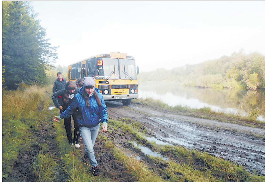
Ученикам Лопаевской школы и их бесстрашному школьному автобусу приходится преодолевать экстремальные километры, перед которыми, пожалуй, оробел бы и внедорожник

Кто на Среднем Урале не знает о проблеме моста через речку Лату в Новолялинском районе, тот не читает «ОГ». За последний год мы писали про это как минимум трижды. И вот очередной повод: дорожная инспекция закрыла автобусный маршрут для перевозки детей из села Коптяки и деревни Красный Яр в школу села Лопаево. Чтобы ребята не пропустили уроки, учителя приютили их в своих домах.