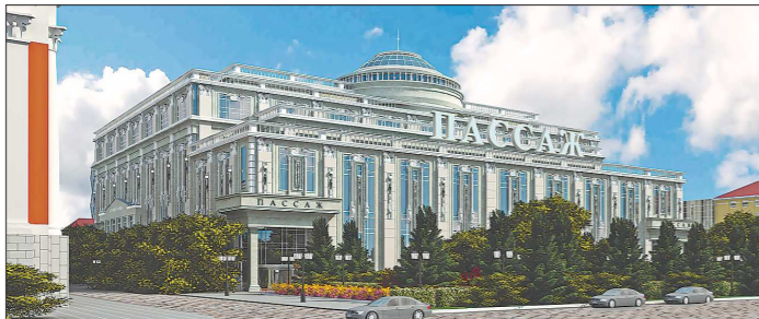
Проект торгового центра Пассажа в центре Екатеринбурга

Больше года прошло с момента сноса старого Пассажа. Однако строительство нового торгового центра, кажется, затягивается — над историческим центром города поднимаются пока только металлоконструкции, составляющие каркас здания. Интересно, почему строители не спешат — спрашивают горожане.