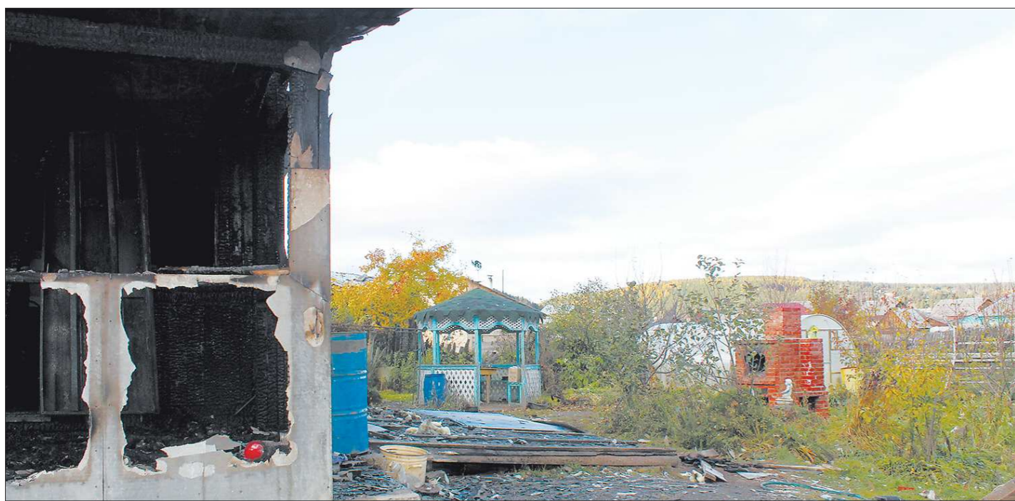
Русская печь и беседка во дворе остались как воспоминание о счастливых лете и ласковой маме

Нашим инвалидам повезло — нашлись. И даже, в помощь будущим владельцам, обучили четыре десятка волонтеров управлять новыми колясками. На случай, если возникнут затруднения.