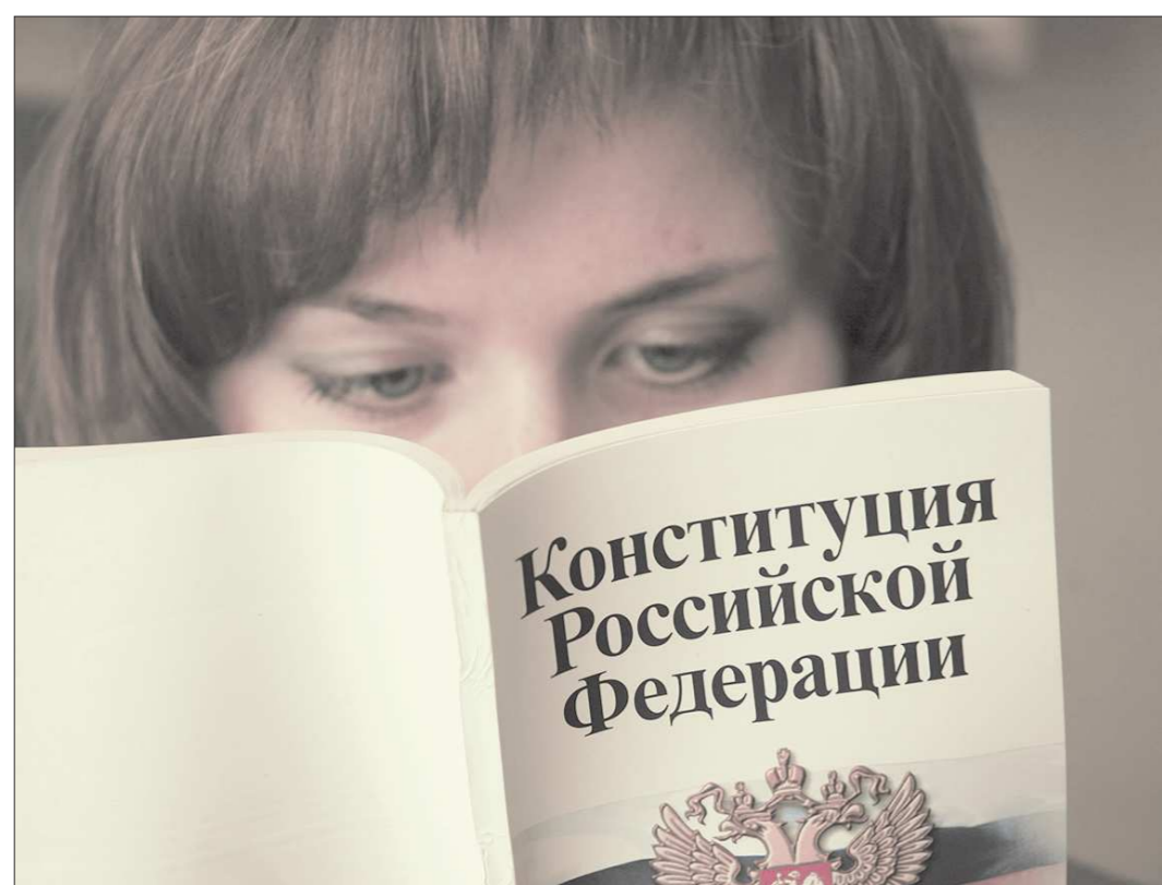
Любому россиянину полезно почаще заглядывать в текст основного закона нашей страны

– Есть ряд существенных проблем с реализацией программы «Духовный центр Урала», – признал губернатор. – Сейчас Свердловская область выступает в достаточно сложной в финансовом отношении период, я бы назвал его временем чёткого обоснования бюджетных расходов и экономии средств. Безусловно, на нас остаётся ответственность за выполнение ранее принятых обязательств, в том числе по тем программам, которые касаются Верхотурья. То же относится и к руководству муниципалитета – нужно усилить эффективность бюджетных расходов, снять административные барьеры, привлечь инвесторов.