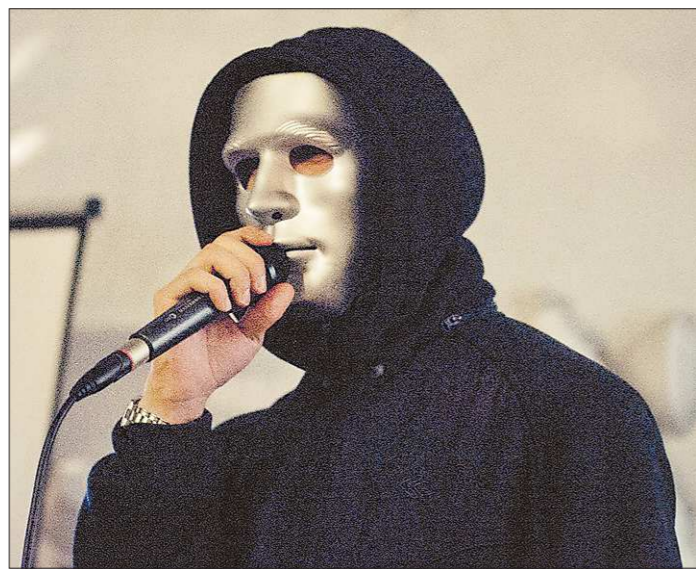
Если не хватает слов, поэт остаётся безликим