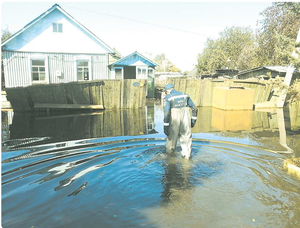
Хотя в середине сентября уровень воды пошёл на спад, помощь спасателей была местным жителям просто необходима