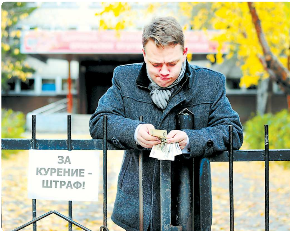
Теперь, прежде чем закурить, впору проверить бюджет – хватит ли денег оплатить, в случае чего, штраф

В моей школе давно борются с курением. Первую неделю учёбы около выхода из здания добросовестно дежурили завучи, не выпускали никого и ни при каких обстоятельствах. Центральный вход от массовой атаки круглосуточно спасают камеры видеонаблюдения.