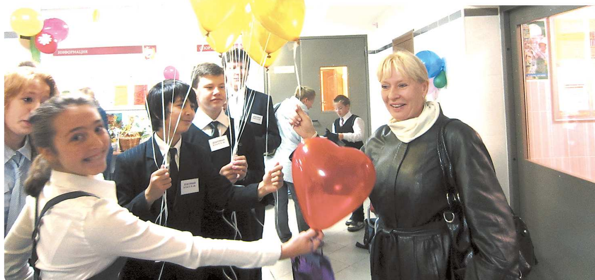
В день учителя ученики подкарауливают своих педагогов у дверей школы с самого утра

–В ночь на наш «Последний звонок» мы решили сделать сюрприз нашей