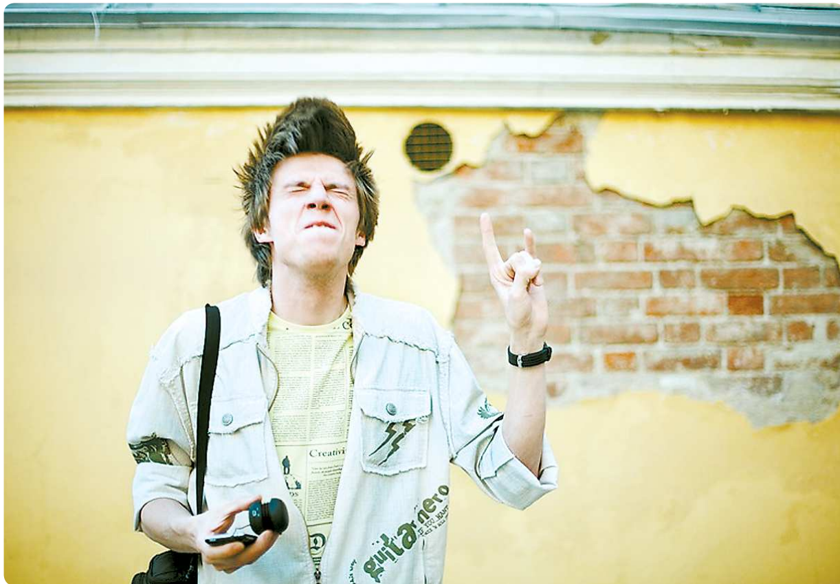
Радость от того, что ты стал студентом, оказывается недолгой. Жизнь в университете готовит немало трудностей

—Переход с одной специальности на другую возможен только после сдачи первой сессии. Для перевода вам нужно предоставить своему ректору заявление о смене места учёбы. Его подпишут только в том случае, если у вас закрыты все долги. Затем нужно получить справку из деканата, куда ты решил поступить. В ней должно быть написано, что студента допускают до учебных занятий и он будет принят, если представит все нужные документы: аттестат об общем образовании, справка об обучении (1-2 курсы) или академическая справка (3-5 курсы). В этих справках прописывается успеваемость студента. После всей бумажной волокиты вас переведут на другую