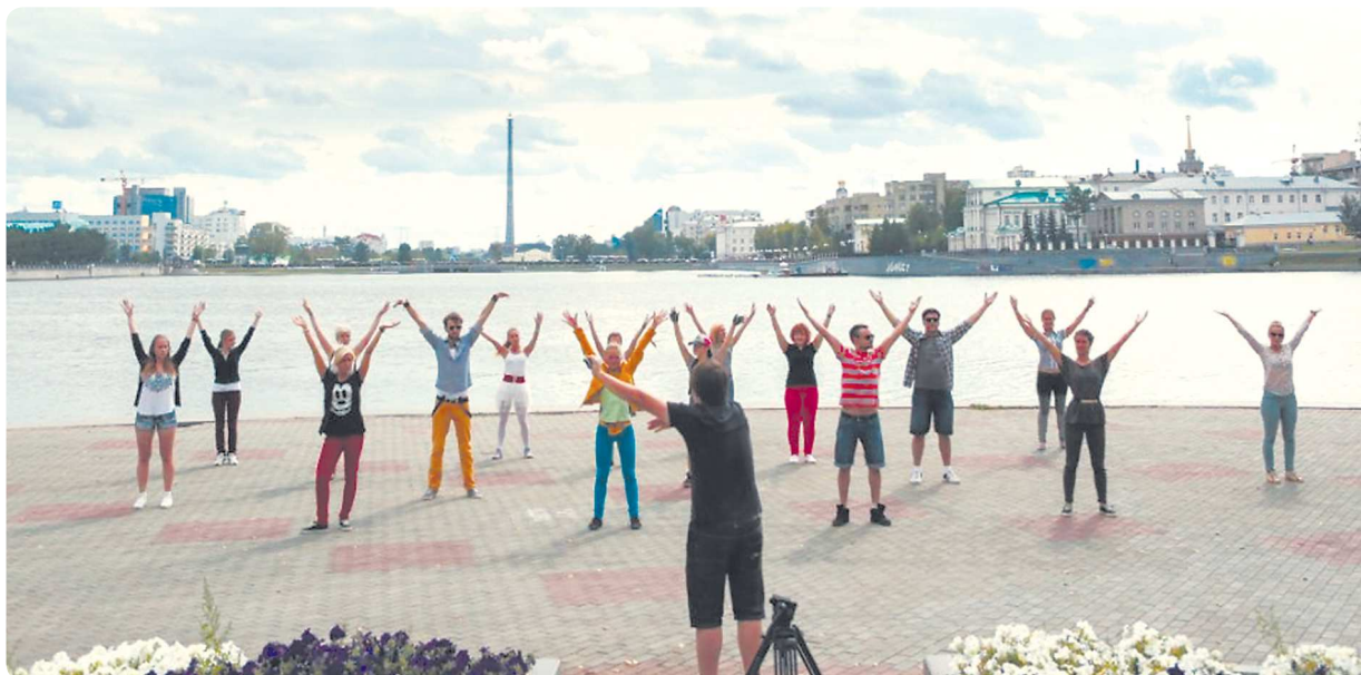
Съёмки мюзикла «Пассажиры» проходили в самых живописных местах Свердловской области

–До нас никто и никогда не делал подобные проекты – интернет-мюзиклы. Мы как бы открывали Америку, тестировали формат. Кое-где, конечно, мы допустили просчёты. Но теперь намерены провести работу над ошибками. В прошлый раз мы брали на съёмки всех желающих, в этот – вели отбор. Камеры и профессионального оператора тоже недостаточно. Теперь мы взяли в аренду у Свердловской киностудии кран и рельсы, чтобы снять больше