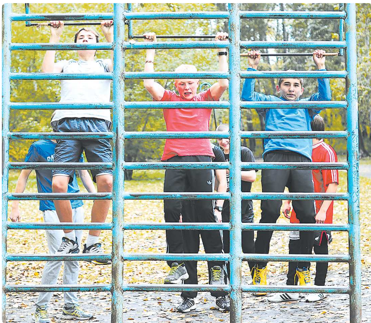
Чтобы победить в этапе «подтягивание», спортсменам нужно подтянуться минимум 200 раз

Парни состоят в Оренбургском казачьем войске. Вообще в казачью общину может вступить любой желающий. В ней числятся родовые казачата, ученики казачьих классов. Вообще, движение казаков в России берёт начало с XV-XVI веков, поэтому в каждой казачьей семье хорошо знают