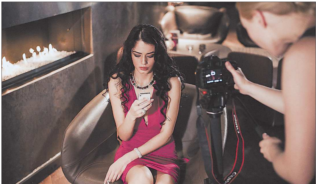
Момент съёмки фильма. Всего в картине сыграло 60 актёров, больше половины из них — не профессионалы. Ищали через социальные сети, театральный институт, привлекали друзей...