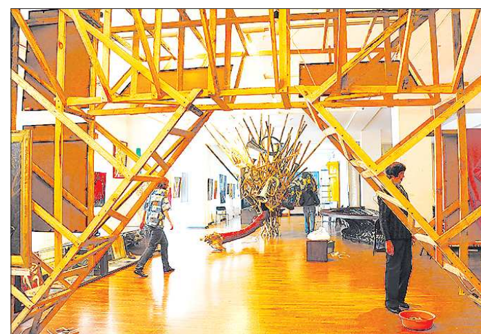
Вдали Древо смерти

но было потрогать рукой. Помните? Эти беспомощно-бритые солдатские затyki, пробитые вражескими пулями, прожжённые от времени каски, лица в анфас и профиль, товарищ Сталин гигантской ногой шагающий по соотечественникам... Металлические контуры гипсовой девушки с вёселом и пропороциями, идеально соответствующими строительнице коммунизма. Девушка шагала через годы. Сначала – из советских садов и парков – в Музей молодёжи. Оттуда, уже нынче, в Музей истории Екатеринбурга.