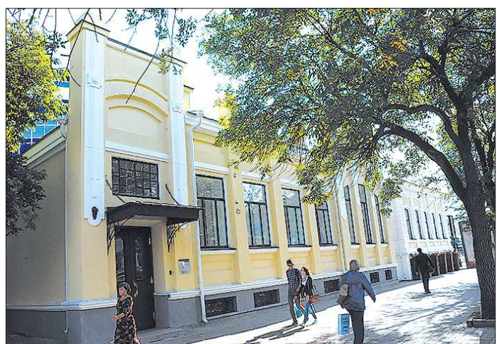
Когда-то здесь был Музей молодёжи. Теперь очередной банк

«Превращение. Страницы памяти Музея молодёжи» – выставка с таким названием открылась в другом музее, Музее истории Екатеринбурга. Сосед и правопреемник Музея молодёжи, а можно сказать и его прародитель, Музей истории Екатеринбурга хранит в своих запасниках немалую коллекцию, собранную Музеем молодёжи за десятилетия его существования. И то, что когда-то, может быть, поражало чьё-то воображение, сегодня кажется уже вполне вписанным в лептосис бытия.