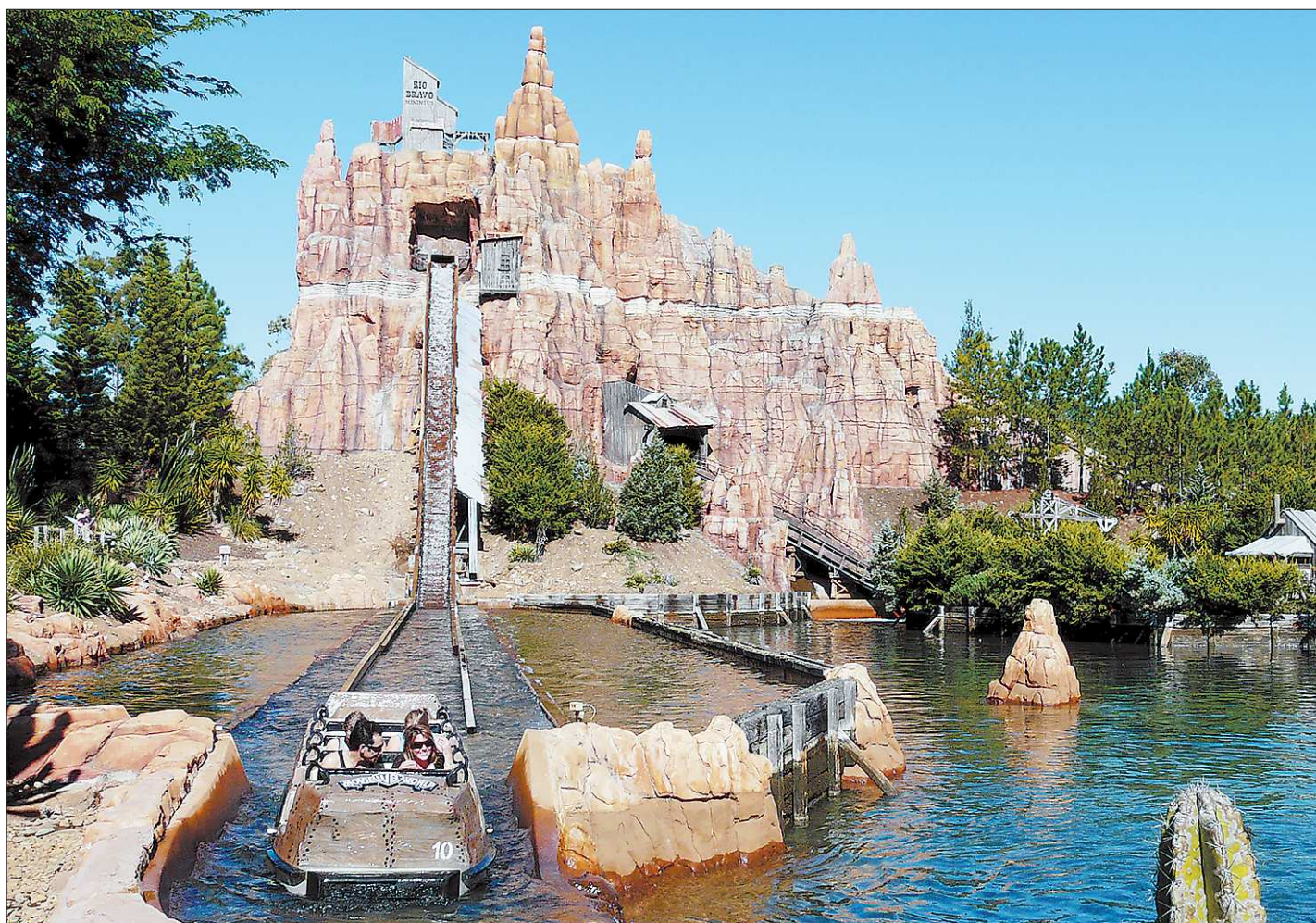
Через несколько лет свой DreamWorks (не хуже, чем в Австралии) может появиться и в столице Среднего Урала. Он будет располагаться в районе Полевского тракта и улицы Новосибирской, неподалёку от нового микрорайона «Солнечный», строительство которого уже началось

Кстати, готовность Среднего Урала к осенне-зимнему периоду уже получила высокую оценку в Минрегионразвития РФ.