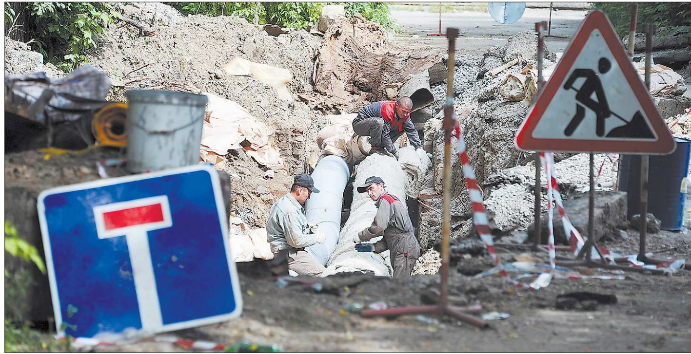
Нынешним летом немало улиц в уральских городах оказалось перекопано из-за замены трубопроводов, но зато зимой в домах будет тепло

Министр подчеркнул, что Свердловская область стала одним из первых регионов в УрФО, где для решения жилищного вопроса бюджетники используются такой механизм.