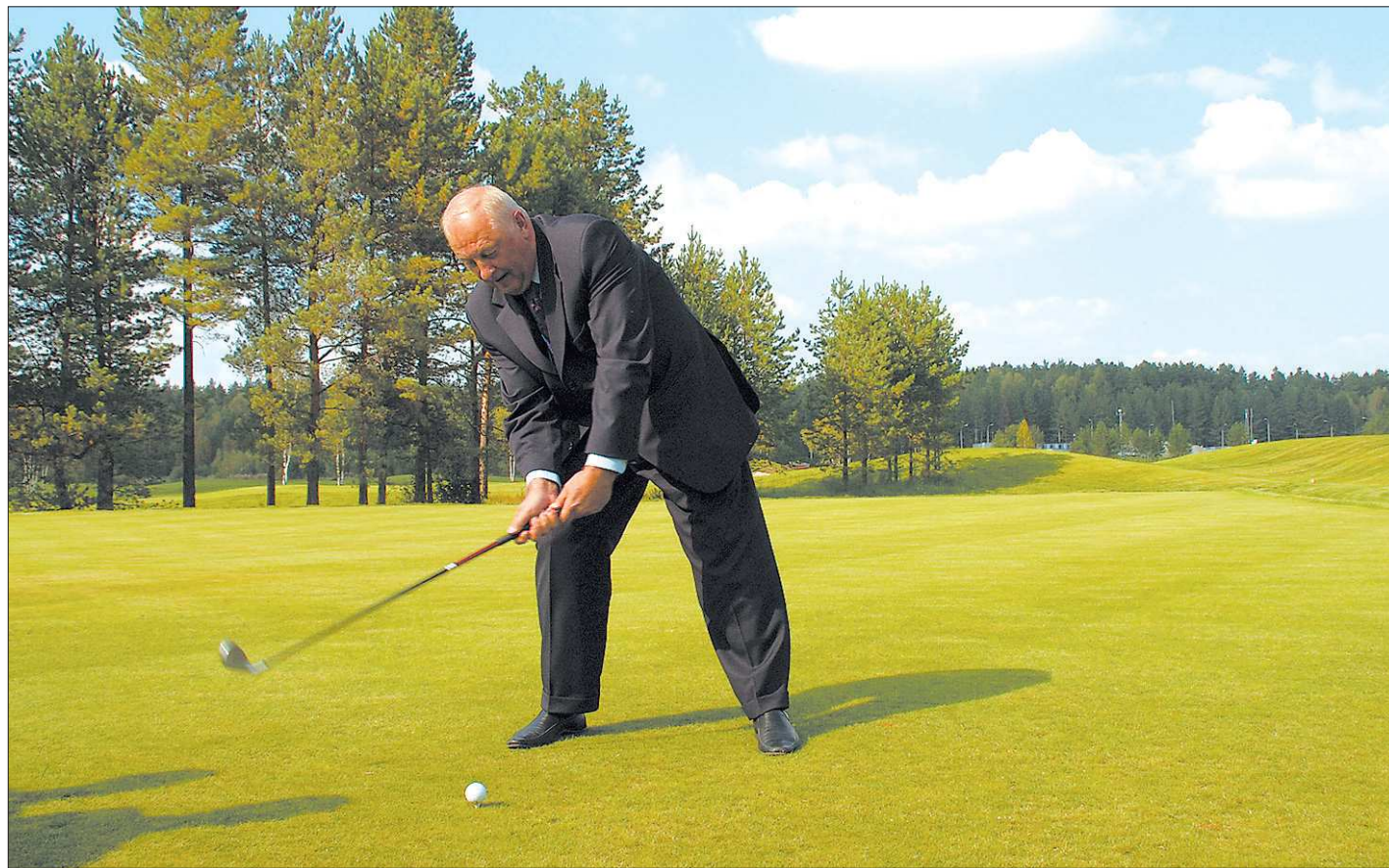
Первый на Урале гольф-клуб был открыт летом 2011 года. Идея его создания поддержал прежний губернатор Свердловской области Эдуард Россель

Зато в руки дают клюшку, да не одну, а целый набор. Играть ими одновременно, конечно, не нужно: у каждого вида – своё предназначение. «Вудом» мяч выбивают с первой площадки, «паттером» загоняют в лунки. Самые «труднолюбивые» – клюшки «айроны» под всевозможными номерами: чем он больше, тем дальше летит мяч. Ими гольфисты играют всё остальное время на фрагментах поля разной сложности. Оказываются, искусственные объекты