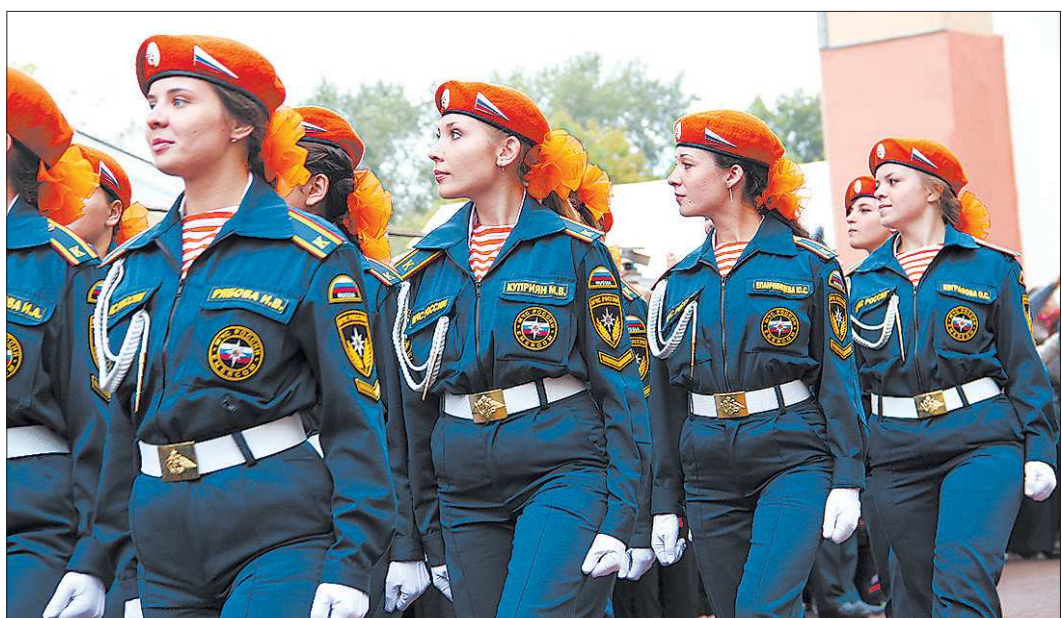
Полажечка девчатам никто не даёт: дисциплина у людей в погонах прежде всего. Как все остальные курсанты, они ходят строем, стреляют и живут по уставу

Мероприятие ГИБДД «Скорость. Встречная полоса» продлится до воскресенья, 15 сентября, включительно.