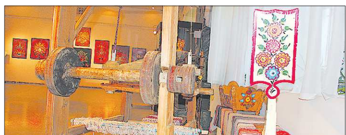
Из предметов быта чаще всего расписывали прятки

На выставке «Сказочный мир уральской росписи» – действительно сказочная красота. Чтобы сделать свой дом уютнее, крестьяне расписывали внутренние стены дома, потолок, утварь, рамы... Вот только век уральской росписи – совсем короткий. Разберёмся почему.