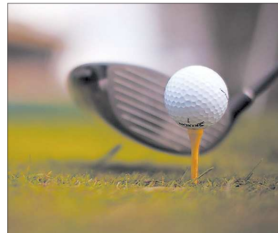
После удара гольфиста мяч летит со скоростью до 180 метров в секунду. Во время полёта он сжимается и становится процентов на 30 меньше в размере

Впрочем, за обучение нужно платить не всем. С