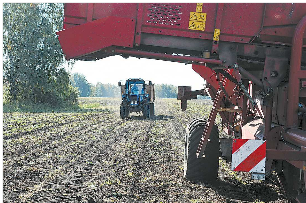
В этом году в Свердловской области картофелем заняты 15 тысяч гектаров, и ещё две тысячи гектаров — овощами