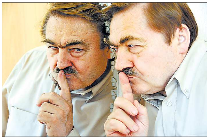
Время собраться с мыслями