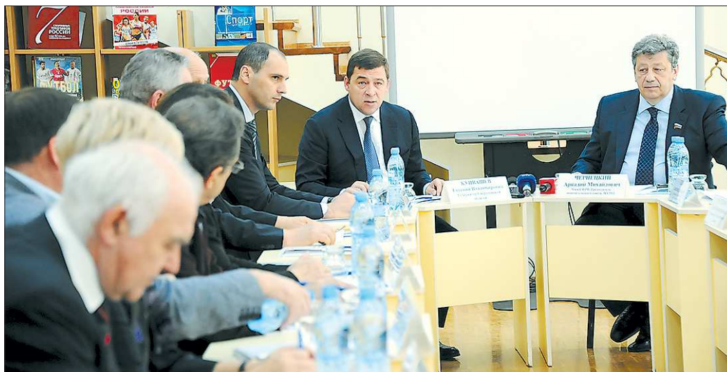
Губернатор Свердловской области Евгений Куйвашев (в центре) уверен, что благодаря крупным международным проектам Екатеринбург обретёт новый, ещё более современный облик

Вчера на встрече с активными общественными движениями губернатор Свердловской области Евгений Куйвашев рассказал, как он видит развитие столицы региона, поделился впечатлениями от презентации заявки Екатеринбурга на проведение Международной выставки ЭКСПО-2020, состоявшейся в Санкт-Петербурге.