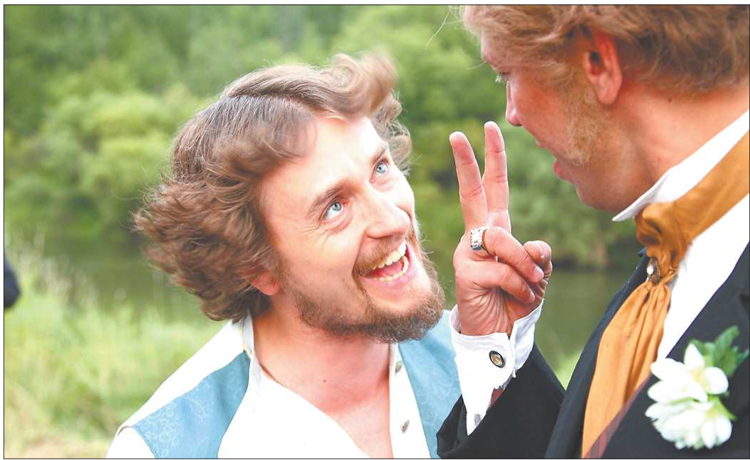
КАРТИНКА ИЗ ФИЛЬМА

— Что, кроме «Золота», в последнее время снималось?