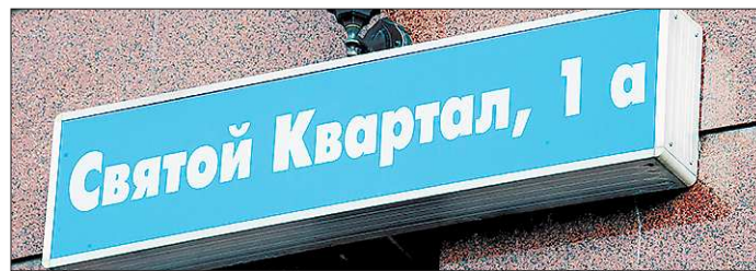
В Екатеринбурге есть улица, которой официально нет. Часть улицы Толмачёва Екатеринбургская епархия самовольно назвала «Святой квартал»

Старейшая улица города появилась ещё на территории первоначальной крепости Екатеринбургского завода. В разное время она называлась Большой, Прешпективной, Главной прешпектив-