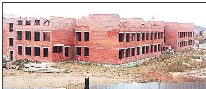
Такой школьная стройплощадка была ещё полгода назад