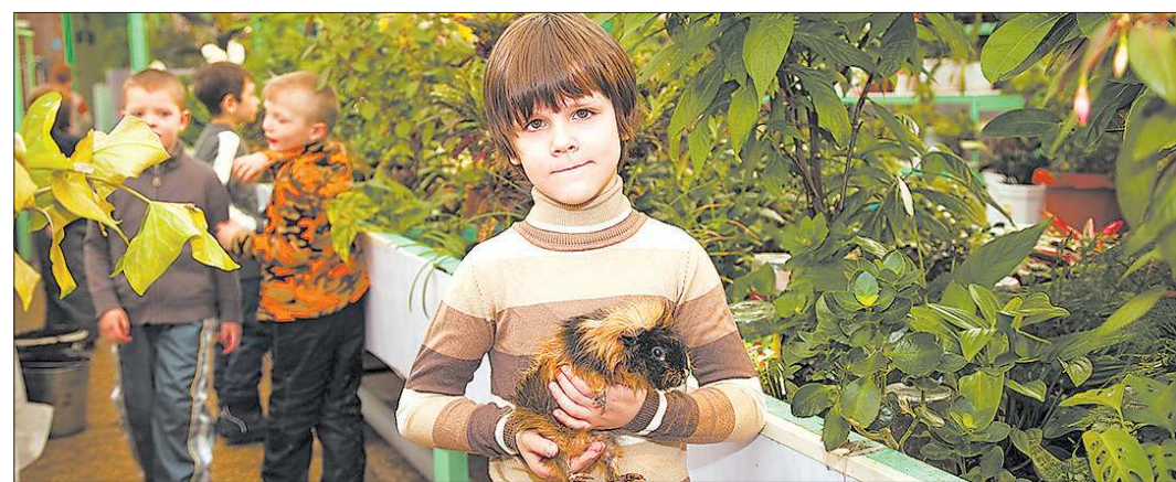
В каждом центре дополнительного образования детей своя особая, уютная атмосфера